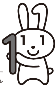
マイナンバーキャラクター マイナちゃん