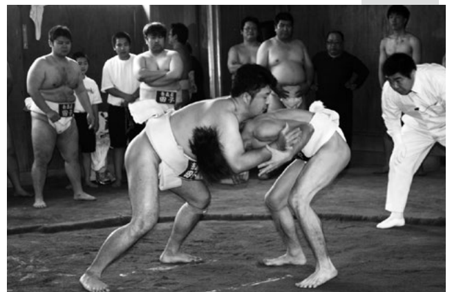
昨年の三戸郡総合体育大会の様子 上からバレーボール、野球、相撲