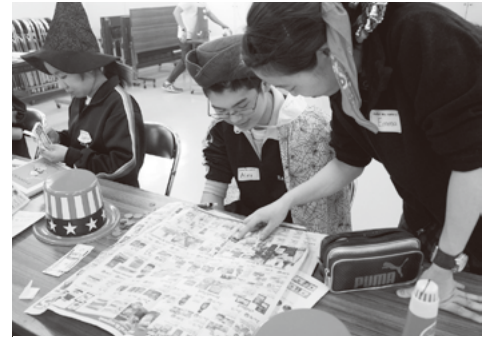
アメリカのチラシを使ってお金を勉強

(4)の三姉妹がつとめ、「これからも元気で長生きしてください」とプレゼントを手渡しました。 アメリカ日帰り旅行!? イングリッシュ・デイ・キャンプ 3月28日、中央公民館でイングリッシュ・デイ・キャンプが行われました。これは、田子町に近く国際交流協会(原昌徳代表理事)主催によるもので、町内の中学生を対象に、ゲームやアクティビティを通して英語に対する自信と興味・関心を高めることを目的とし、「アメリカ旅行を体験しよう!」をテーマに実施されました。