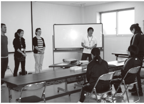
まずは英語で自己紹介から

(4)の三姉妹がつとめ、「これからも元気で長生きしてください」とプレゼントを手渡しました。 アメリカ日帰り旅行!? イングリッシュ・デイ・キャンプ 3月28日、中央公民館でイングリッシュ・デイ・キャンプが行われました。これは、田子町に近く国際交流協会(原昌徳代表理事)主催によるもので、町内の中学生を対象に、ゲームやアクティビティを通して英語に対する自信と興味・関心を高めることを目的とし、「アメリカ旅行を体験しよう!」をテーマに実施されました。