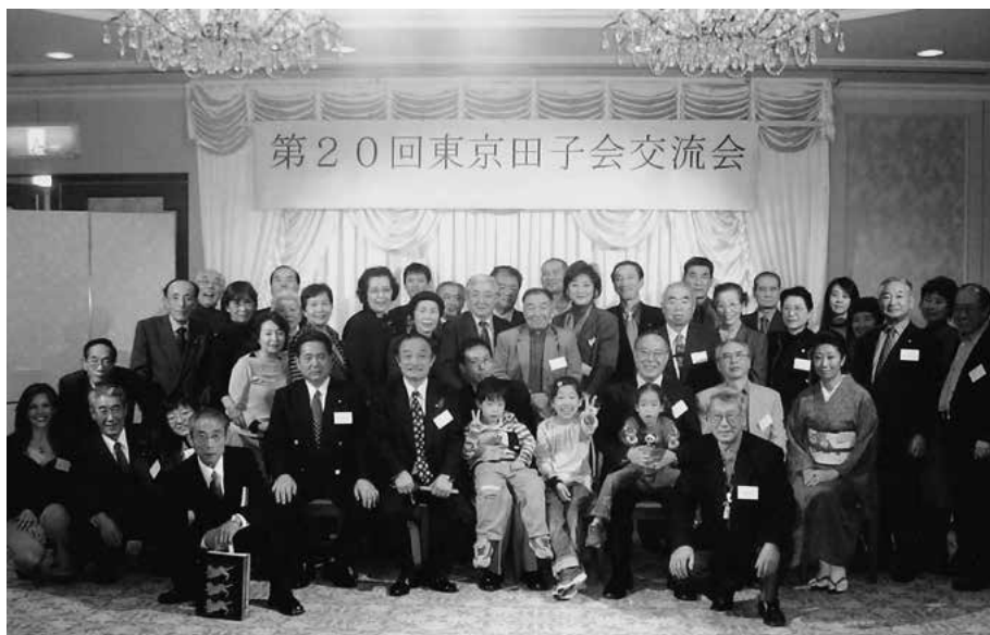
創立20周年時の記念写真（平成17年）