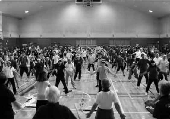
開会式時のラジオ体操

昨年から個人の部はオープン種目とし、誰でも参加でき、幼児からお年寄りまで多くの方に参加していただきました。プログラムの中には、各チームの他に町消防団からも参加していただき、毛布と着衣を利用した担架リレーでは、いかに早く応急担架を作り安全に救護者を運ぶかという、防災を意識した内容に、観ている人も一緒に学ぶことができました。