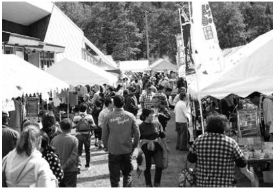
たくさんの人でにぎわう出店