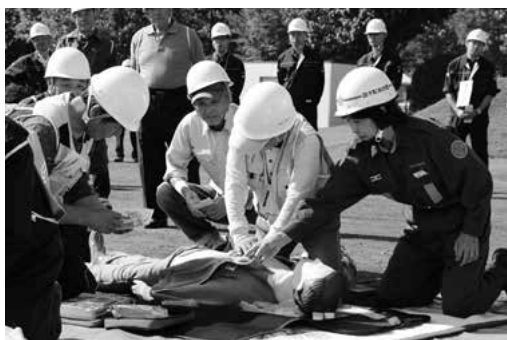
AEDでの心肺蘇生法の実演