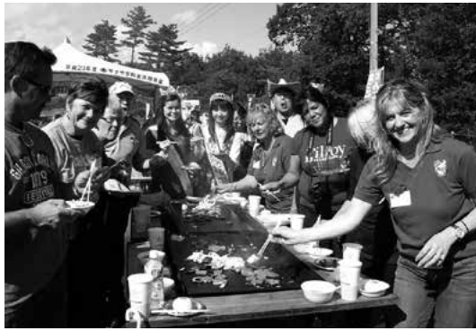
バーベキューを楽しむギルロイ市の皆さん