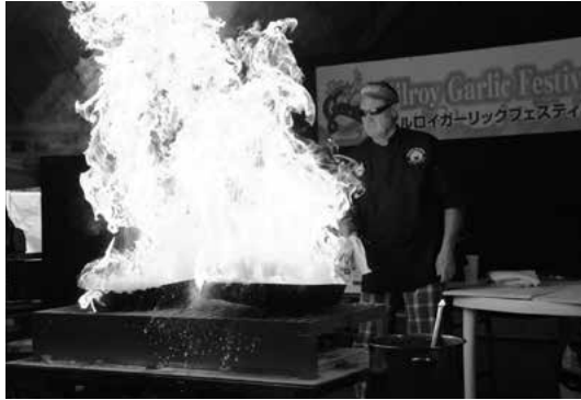
天井まで届きそうな炎。大迫力のパイロシェフ