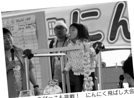
ちびっこも挑戦！ にんにく飛ばし大会