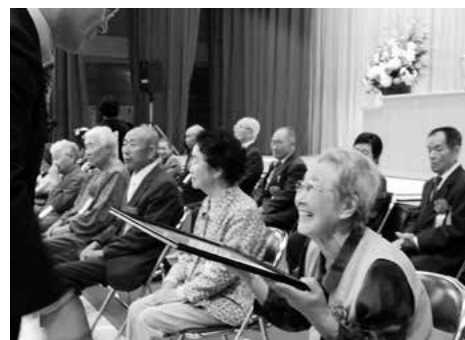
表彰を受ける米寿顕彰者

9月18日、農業者トレーニングセンターで、平成27年度田子町敬老会が行われました。町内各地区から対象者約500名が出席し、100歳到達者と88歳到達者に顕彰状が贈られました。授与式後、出席者らは田子幼稚園、田子保育園、上郷保育園の園児による元気いっばいのお遊戯や、田子高校生による田子神楽、流し踊りなどのアトラクションを鑑賞しながら祝宴を楽しみました。