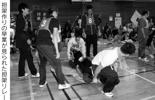
担架作りの早業が見られた担架リレー