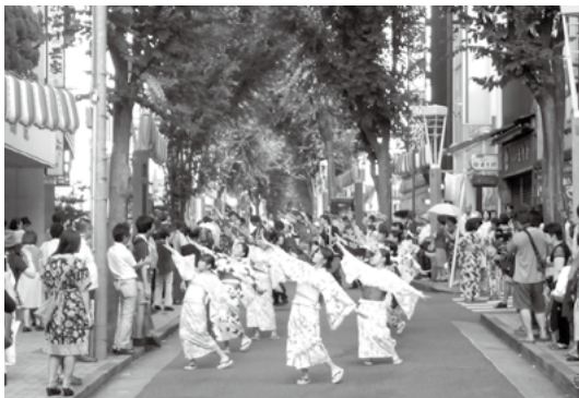
神楽坂で流し踊りを披露する田子高生（平成27年）

最後にあらためて、東京田子会が発足して30年の間、会の維持のため田子町からいただいた数々のご支援に、心から感謝を申し上げます。並びにこの度の神楽坂商店街の皆様からいただいた温かいご協力に、深甚なる感謝を申し上げます。