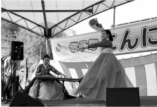
韓国瑞山市の華麗な伝統文化公演