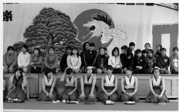
昨年度の成果発表会