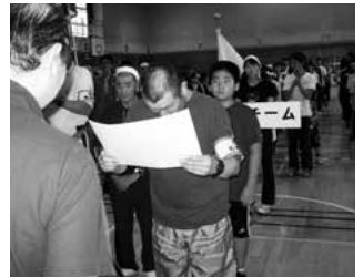
今年度優勝の石亀チーム→