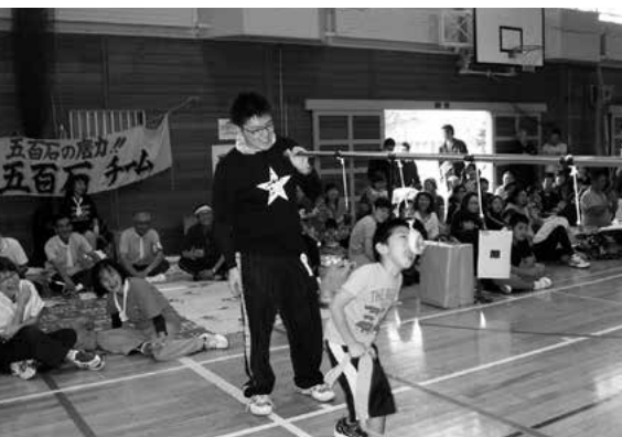
笑いを誘った障害物（パン食い）

また、幼児から小学生までの障害物レースでは、たくさん子どもたちが参加し、パンを追う子どもたちに会場が笑顔となりました。その他、同じ種目でも屋外とは違う迫力に、観客も大いに盛り上がりました。