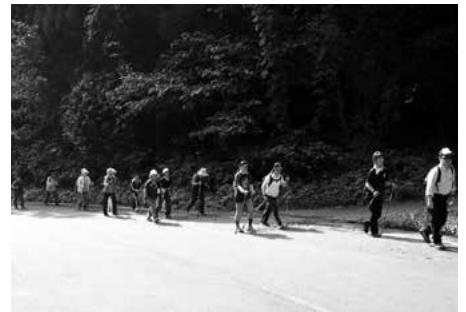
やまごえルートの様子

秋晴れの気持ちの良い“ウォーク日和”に恵まれ、やまごえに挑みました。頂上に辿り着き振り返ると、きれいな葉っぱの濃淡の山々と空の青さが目に入り、上り坂の苦しさが一気にとれその後の歩きの力となりました。途中の稲刈りやにんにく植えの盛んな農道を、和気あいあいと歩くことができました。