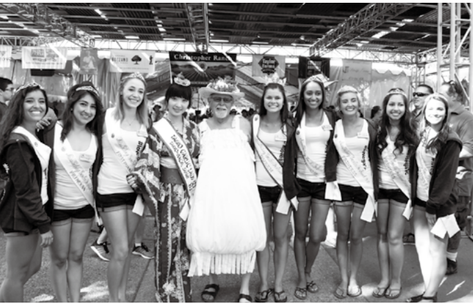
Mr. ガーリック (中央)・ガーリッククイーン (右から5番目) とプリンセスたち

に、アメリカへ行くという実感が少しずつ湧いてきました。それと同時にガーリックレディとしての役目をきちんと果たせるかとても不安でした。飛行機の中でも緊張のせいか落ち着くことができませんでした。