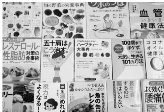
自分に合う健康法を探しませんか？

9月21日は敬老の日です。図書館では「健康」に関する本を集めて展示・貸出します。この機会にどうぞ図書館をご利用ください。