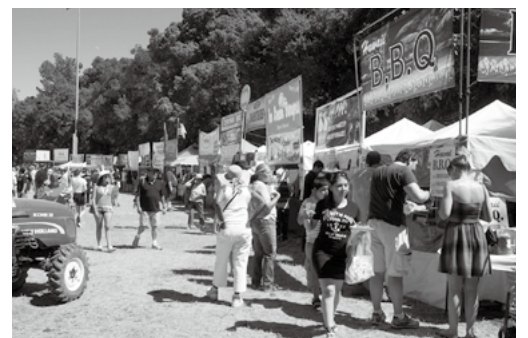
ガーリックフェスティバルの様子

また、フェスティバル会場にいるスタッフの約4千人がボランティアだと聞き感激しました。私は運営している全てのスタッフやギルロイ市の皆さんが心からこの祭りを愛し、守り続けているからこそ楽しい祭りになっているのだと感じました。今回ギルロイ市に訪問して思ったことは、もっと田子町を人の集まる町にしたいということです。10月3日から10月4日には「第30回田子町にくくとべごまつり」が開催されます。今度は私たちが迎えする立場として心配りをしていかなければなりません。笑顔を忘れず自分から声かけをしていきたいです。また来てくださるたくさんの方に田子町の良さをアピールできるよう全力で頑張ります。また、今回は、ギルロイガーリックフェスティバルで大盛況のパイロシェフが行われる予定です。迫力満点のパフォーマンスを多くの方々に、ぜひ近くでご覧になっていただきたいと思えます。