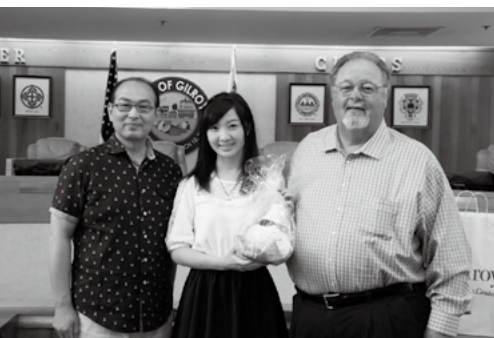
ギルロイ市長を表敬訪問

でもギルロイ市に到着し、姉妹都市協会の方やホストファミリーの皆さんと対面するなり、その明るさとフレンドリーさに自然と肩の力が抜け、強ばっていた私の表情も和らいでいききました。慣れない英語であいさつをするのも一苦勞でしたが私たちを迎えてくれたホストファミリーのジョ