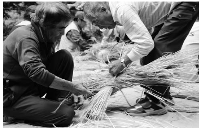
わら人形づくり（飯豊）

就、天下太平、家内安全などの願いが書かれたのぼりを持って集落内を回り、悪い虫を集落外に追い出します。 江戸時代から続く伝統行事で、県の無形文化財に指定されていることから県外の方からも注目を集めています。