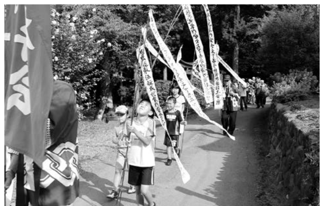
虫追いの行列（細野）