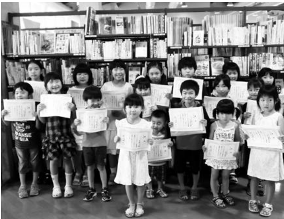
←たくさん本をよんだよ！