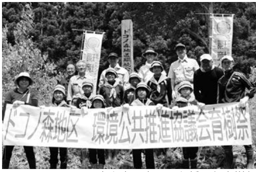
森を守り育てると誓った育樹祭

この少年団は、清水頭小学校3年生から6年生までの児童9名で構成されています。誓いの言葉では、「ぼくたちが下草を刈ることで、森本来の力を発揮することができるとです。次の世代を担う僕たちが、自然の緑と親しみ、責任を持って守り、育て、未来に受け継ぎ、