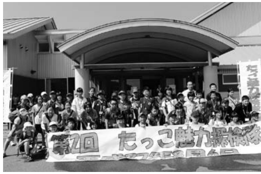
町の農林畜産業を体験する児童たち

町の農林畜産業を体験 「たっこ魅力探検隊」 8月6日、町内3小学校の6年生を対象に、第2回たっこ魅力探検隊が行われました。