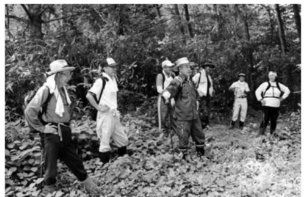
県境の尾根で休憩する参加者

同協議会役員ら13人で役場前を車で出発し、国道104号から103号を秋田県鹿角市に向かって走り、大湯側の登山口に到着しました。上りは木立の中が多くて歩きやすく、30分ほどで県境の尾根に到着しました。尾根で休憩を取った後、みろくの滝を目指して下り始めました。途中急な傾斜の道や土砂が崩れて歩きにくい所もありました。熊原川源流を横切って下り続けましたが、今年は思いのほか水が少なく楽に渡ることができました。また断崖になっている所や不老倉鉾山の跡があり、当時の状況を思い浮かべることができました。再度熊原川源流を渡った所で現地踏査は終了し、下り1時間の道のりでした。