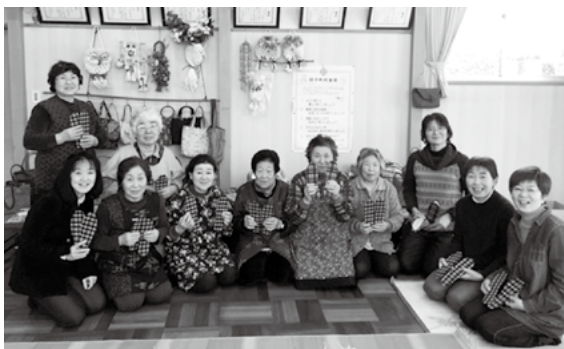
下田子のみなさんと靴の中に入れる中敷を作りました(川名)

町内の皆さん、どなたでも参加できる Takko cafe club の参加を募っております。ケーキやお菓子、その他加工品などを一緒に作りたいと思っておりますので、よろしく願います。(川名美夏)