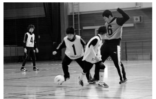
相手をかかわしてボールをつなげる

試合では中学生以上による一般の部と、小学生以下と一般の合同によるMIXの部があり、一般