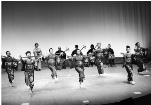
民舞踊子すずめ会