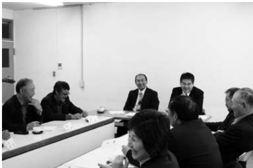
意見交換会の様子

農業委員会は毎年1回「農地パトロール」を実施しており、その結果をふまえて委員全員から意見を出していただき、耕作放棄地となる問題点や今後の展望などについて話し合いました。耕作放棄地になる原因は、後継者がいないことや米価の下落