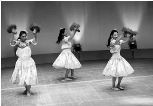
k o c i u b によるフラダンス

田子神楽保存会技芸部の「天形舞」をはじめ、民舞踊子すずめ会による息のそろった舞踊等、出演者の堂々としたステージは会場に詰めかけた観客を喜ばせていました。