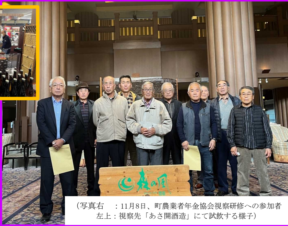
(写真右 : 11月8日、町農業者年金協会視察研修への参加者 左上: 視察先「あさ開酒造」にて試飲する様子)

今町農業者年金協会の活動は、町民の生活に貢献し、地域の活性化を図ることを目的として行っています。今年度は、視察研修を通じて、他地域の先進事例を学び、協会の運営を向上させることを目指しています。また、協会の活動を通じて、農業者の生活の安定を図ることも重要な課題です。協会の活動は、農業者の生活の安定を図ることを目的として行っています。今年度は、視察研修を通じて、他地域の先進事例を学び、協会の運営を向上させることを目指しています。また、協会の活動を通じて、農業者の生活の安定を図ることも重要な課題です。