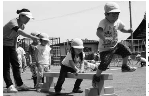
町長と王子にチャレンジ