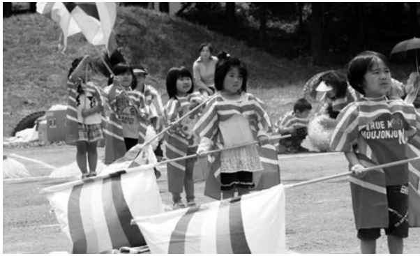
宇宙組のかっこいいカラーガード (幼稚園)