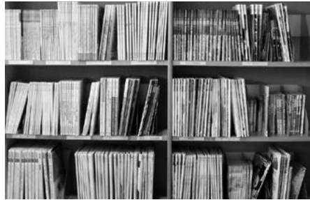
貸出できるのはこちら、図書館入口近くにあります

最新号は貸出していませんが（図書館でご覧ください）最新号以外の雑誌は、本と同じように貸出します。どうぞご利用ください。