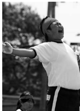
エール交換 (田子小)