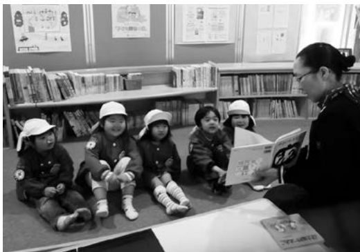
田子幼稚園宇宙組の図書館見学～夏休みも図書館に来てね

▽内容 期間内に何冊の本を借りて読めるか、自分の記録に挑戦します。参加者は図書館で記録用紙をもらって挑戦してください。