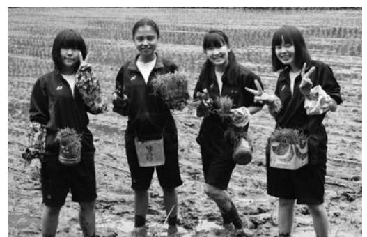
田植えを手伝う女子生徒たち

5月25日から27日までの3日間、神奈川県横須賀市立衣笠中学校の生徒35名が、農業体験修学旅行で田子町を訪れました。生徒らは3名から5名の班に分かれ、2泊3日の日程で町内各農家へ滞在し、田植えや枝豆の苗植えなどの農作業