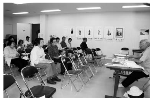
談話室、第1回目の様子

全6回の中で、町内各地区から題材を取り上げ講話が行われます。第1回は下田子地区で、地名「田子」の起りや千人塚、真清田神社などについての講話がありました。談話室と銘打っただけに、馬場さんが昔語りのような語り口で話し