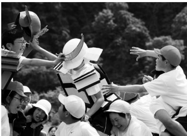
熊原川の合戦'14 (上郷小)