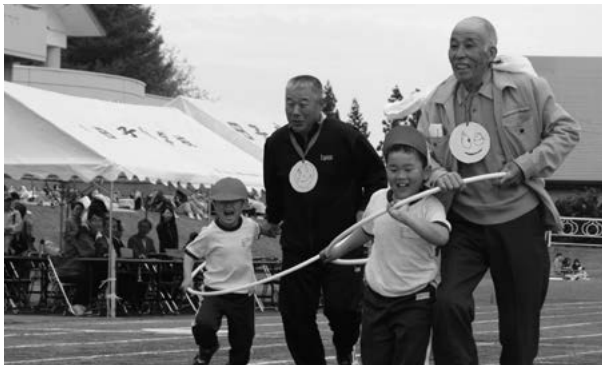
おじいちゃんといっしょに走るぞ！ (田子小)