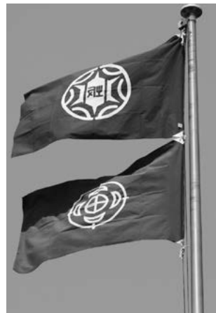
役場に掲揚された小坂町の町旗