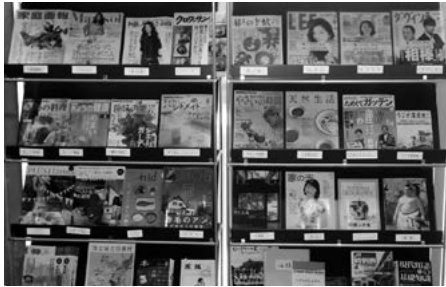
雑誌コーナーでは自由にご覧ください

図書館には、購入寄贈合わせて34種の雑誌があります。これまであった雑誌に「クロワッサン」「相撲」「住む。」などが新たに加わりました。