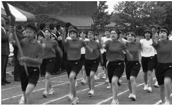
堂々とした入場行進 (田子中)

田子幼稚園では、競技の合間に行われたマスゲームやよさこいで、小さな体を大きく動かして表現する園児たちに、保護者らは目を細めていました。