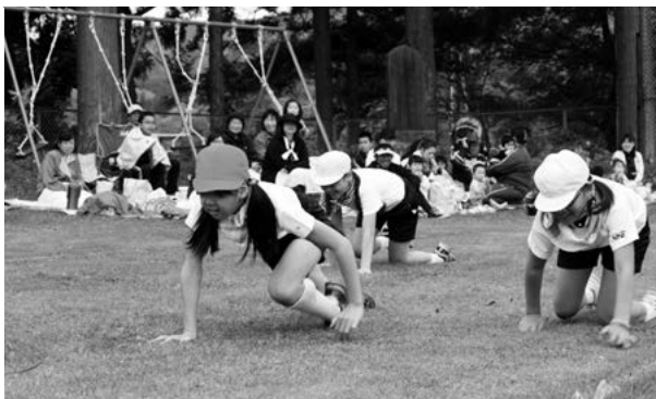
成長の軌跡 (清水頭小)