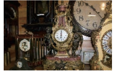
(右下) NHK朝の連続テレビ小説「花子とアイン」に出てくる時計