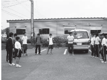
合宿前のミーティングの様子

9月7日(日)に、第22回青森県民駅伝競走大会が青森市内駅伝コースで開催され、33.8Kmを8人のランナーでたすきをつなぎます。