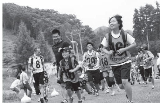
エッコロコース、スタート!

7月13日、タプロップ創遊村で第2回たっこグルメラソンが開催され、町内外から100名を超える参加者が参加し、エッコロコース(3km)とパノラマコース(10km)を走りました。