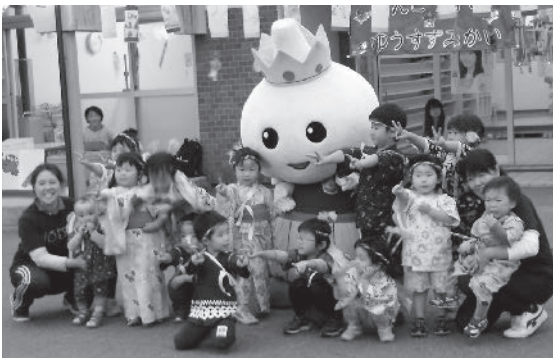
たっこ王子とピース (上郷保育園)

7月上旬から中旬にかけ、幼稚園と各保育園で夕涼み会が行われました。園児による元気いっぱいの遊戯や、保護者による工夫を凝らしたダンスなど、会場を訪れた人々は大いに楽しんでいました。また、田子高校郷土芸能部による盆踊りは、来場者も輪に加わりみんなで踊りました。