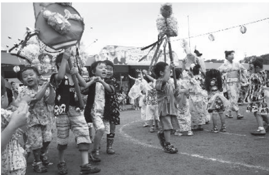
みんなでわっしょい! (田子保育園)