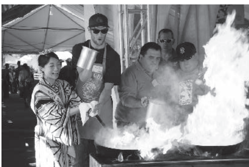
パイロシェフ（炎の料理人）体験