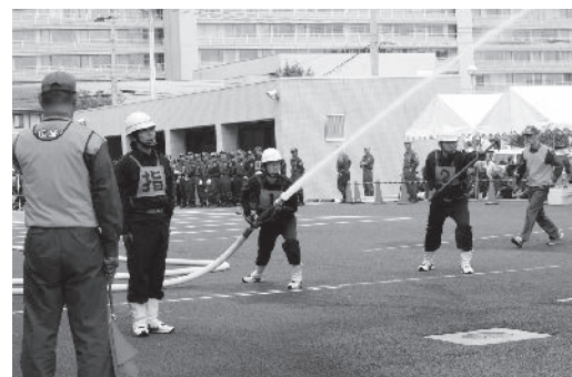
小型ポンプ操法の様子

7月24日、三戸畜産農業協同組合で第8回三八地方畜産品評会が行われました。今回は「黒毛和種の部」と「日本短角種の部」の2部