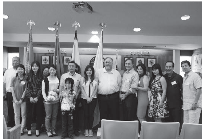
ギルロイ市長表敬訪問の様子