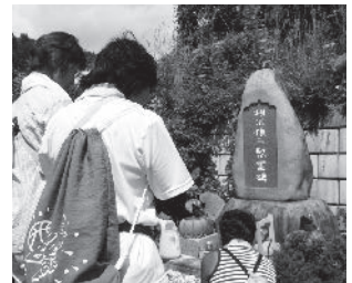
相米慎二氏の慰霊碑の前で

今回は、原から上郷地区の「上郷Aコース」を歩きます。何が発見できるか楽しみです。次回からの参加も可能ですので、参加されたい方は、中央公民館へお問い合わせください。