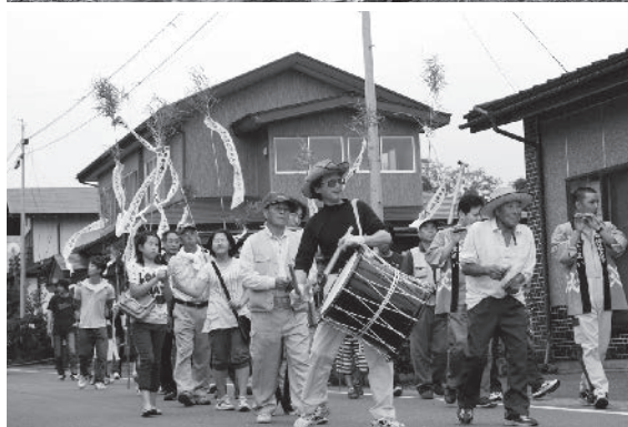
(上) 細野地区 (下) 飯豊地区