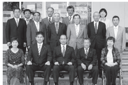
新しく農業委員となった方々