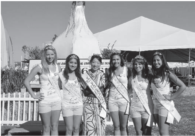
ガーリッククイーンのリトニーさん（右から3番目）とプリンセスたち

なるものだなと改めて感じました。 今回このような機会をいただき、たくさんの人と出逢い、また貴重な経験をさせていただいたことに、心より感謝いたします。 ギルロイ市姉妹都市協会や、ギルロイガーリックフェスティバル実行委員会の方々に、10月の「にんくとべごまつり」に来ていただいた際には、今回の感謝の気持ちと、これからの姉妹都市友好関係をよりよいものとしていけるよう、ガーリックレディとして頑張りたいと思います。