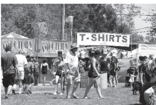
フェスティバルの様子