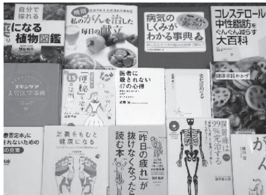
自分にあった健康法を探しませんか？

9月15日は敬老の日です。誰もが願う健康。年齢を重ねるとともに、元気な心と体のありがたみが分かってきます。図書館では「健康」に関する本を特集し、展示・貸出します。どうぞこの機会にご家族みなさんと図書館をご利用ください。