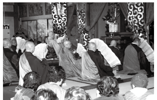
お経をあげる僧侶ら

れており、町内の小学校より応募された約100点の作品が三月の彼岸中日まで展示されています。