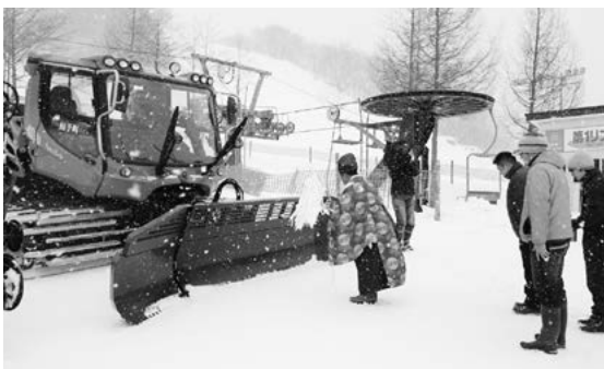
今シーズンの安全を祈願