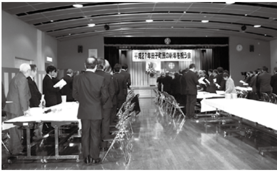
町民憲章を参加者全員で唱和

新年の訪れを祝い活躍を決起し新年を祝う会 1月5日、中央公民館で平成27年田子町民の新年を祝う会が行われました。これは、町と町商工会、八戸農協田子支店の主催により毎年行われているもので、町内から約90名が出席しま