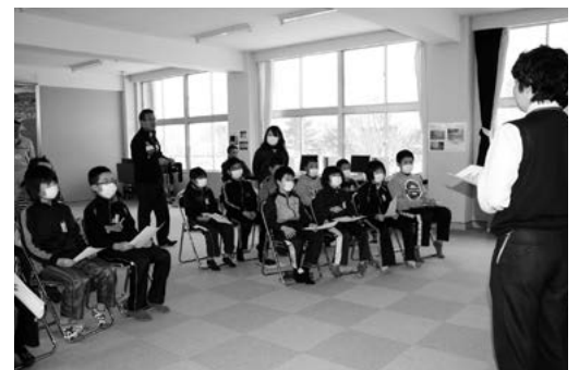
上郷小での授業の様子

金がない世界はどうなっているのかなど、税金の使い道を勉強しました。また、世界で一番高い税率の国などの紹介もあり、児童らは税金の仕組みと大切さについて理解を深めました。