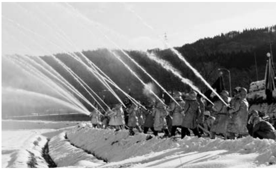
一斉放水訓練の様子