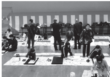
前回の新春書き初め大会の様子

高校・一般 「この道しかない春の雪ふる」 詳しくは、中央公民館までご連絡ください。