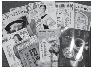
人気のコーナーです