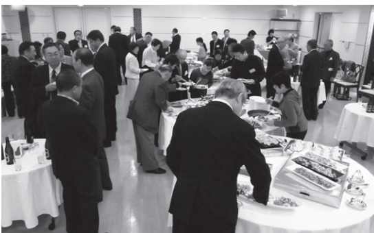
懐かしの味に舌鼓