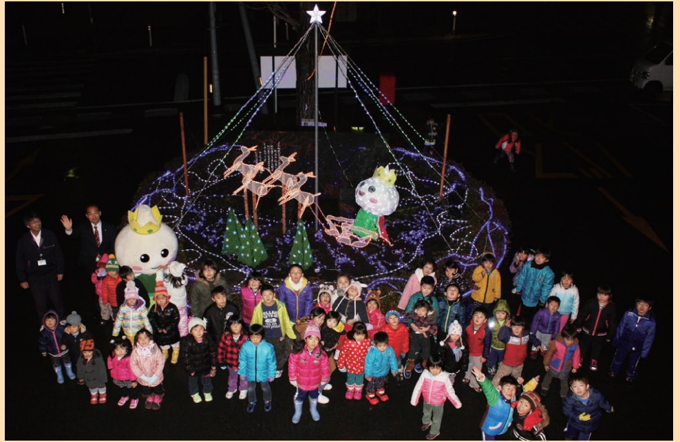
↑イルミネーションの前で 記念撮影

また、役場前の他にも、町内には各家庭で設置したイルミネーションが夜の町を明るく照らし、クリスマスムードを盛り上げていただいております。