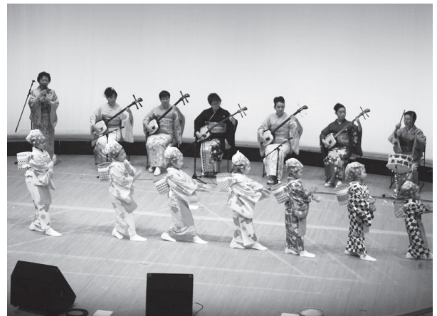
昨年度の芸能発表会の様子