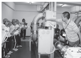
水道施設見学の様子

田子町水道事業でも、安全で良質な水を提供するため、施設の整備・老朽化の更新等を実施します。