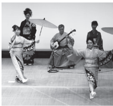
第5回田子町芸能祭

4月上旬、田子地域大学が、3月下旬にタップコピアンプラザで行われた第5回田子町芸能祭の収益金を、田子高等学校郷土芸能部と社会福祉法人田子町社会福祉協議会に活動支援金として寄付しました。同大学は平成22年から芸能祭の収益金を田子高等学校などに寄付しており、今回で4回目の寄付となります。