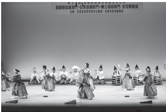
今年も全国高総文に出場する田子高校郷土芸能部