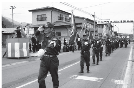
威風堂々の分列行進

4月29日、南部町を主会場に平成25年度三戸地区消防連絡協議会観閲式が行われました。南部町、三戸町、田子町の消防団員らは、観閲者や地域住民に堂々とした力強い分列行進を披露し、地域防災の決意を示しました。