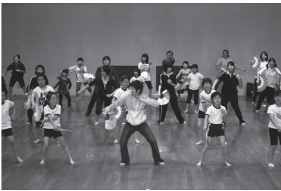
田子神楽後継者養成講座。下は発表会の様子

また、来年度環境省が実施する「風力発電等環境アセスメント基礎情報整備モデル事業対象エリア」の候補地として希望しています。