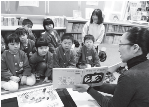
昨年度 田子幼稚園宇宙組 図書館見学の様子