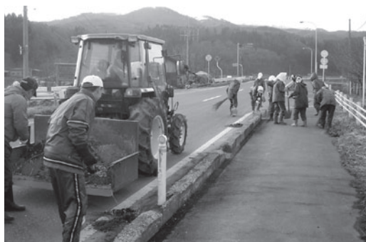
協力して道路掃除（道前地区）