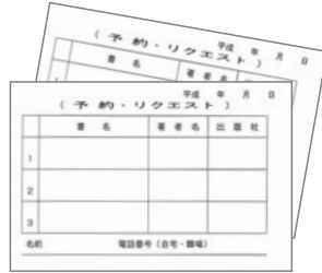
本の予約・リクエスト 申込み用紙