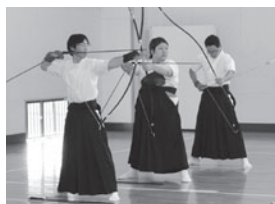
優勝した(上から)相撲・バドミントン・弓道競技