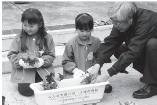
人権擁護委員の方と一緒に花植え 田子小・上郷小・清水頭小・田子幼（左上から時計回り）