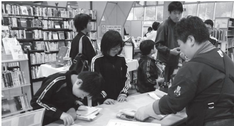
清水頭小学校図書館見学会 も図書館に来てね

▽内容 期間内に何冊の本を借りられるか、自分の記録に挑戦します。参加者は図書館か上郷公民館で記録用紙をもらって挑戦してください。