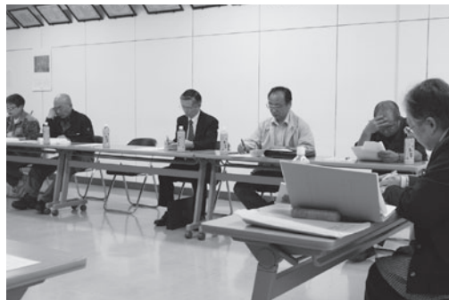
様々な意見が出された会議

5月20日、役場で田子町協働のまちづくり町民会議が行われました。これは、まちづくりについて町民の皆さんと行政が一緒に考えていくために、協働のまちづくり条例に基づいて設置されたもので、委員には自治会連合会など町内各団体から推薦された方と、公募で選ばれた方など20名が選任されています。 今年度は月1、2回の会議を行い、「まちづくり」について話し合いが行われます。