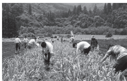
多くの方が訪れた収穫体験