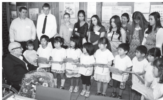
園児とギルロイ市高校生から祝福

で林業に携わり木材の切り出しや炭焼きに精を出していました。また、手先が器用で家族の散髪も行っていたそうです。