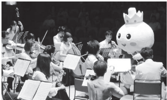
指揮者に挑戦するたっこ王子

町内外から約350名が来場し、バッハの「2つのヴァイオリンのための協奏曲」やメンデルスゾーンの「結婚行進曲」など、全12