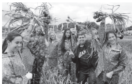
にんにく掘りを体験