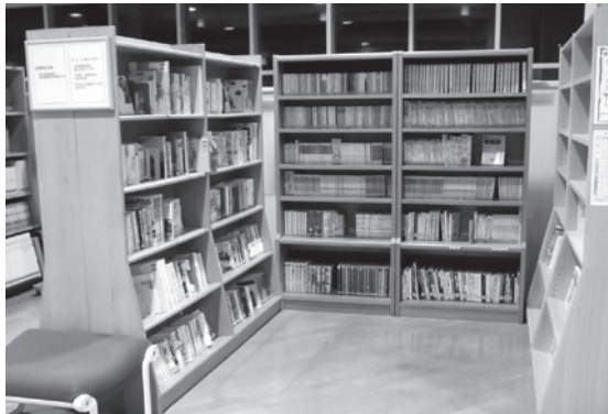
ティーンズではない人にもおすすめのコーナーです