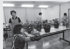
フラワーアレンジメント教室の様子