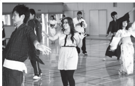
田高生と一緒にナニヤドヤラ