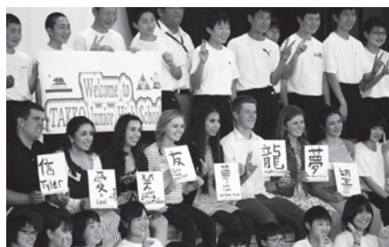
田子中学校での習字体験

8名、引率2名の研修団が来町しました。これは、ギルロイ市の非営利団体「ギルロイー田子短期留学プログラム（G T S E P）」による、青少年の国際教育を目的とした海外派遣事業で、今回で4回目の来町となります。