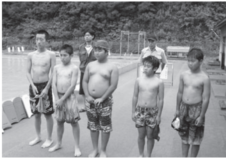
プール開きの様子

※7月30日(火)から8月1日(木)は、水泳教室が開催されていますが、一般開放もしています。