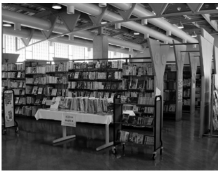
どうぞ図書館をご利用ください