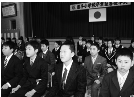
田子小学校の卒業児童

●田子小学校では、3月19日に平成22年度卒業証書授与式が行われ、55人（男子29人、女子26人）に卒業証書が授与されました。卒業