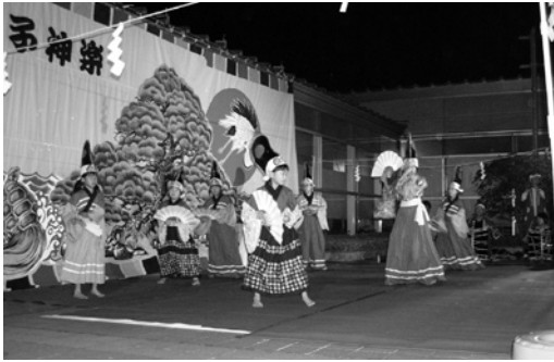
男の子も募集しています