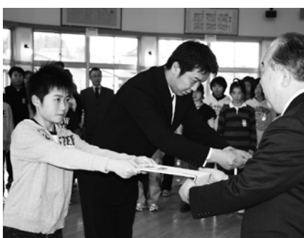
義援金を手渡す児童代表と保護者代表