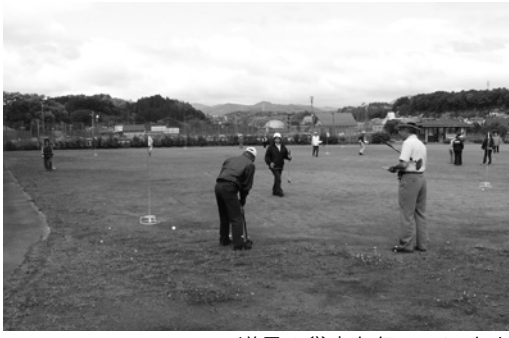
道具の貸出も行っています

団体等のご利用の場合は、事前に教育委員会の許可を得てください。また、テニスコートは整備完了しだいTCV等でお知らせいたします。