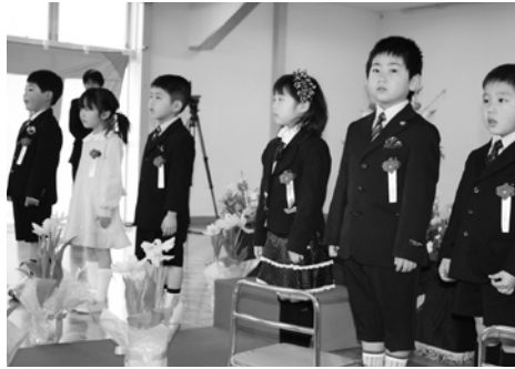
上郷保育園の卒園児

●上郷保育園では、3月15日、平成22年度卒園式が行われ、6人（男子4人、女子2人）の園児が保育証書を授与され、お世話になっ