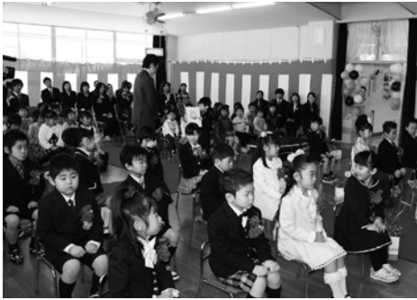
田子保育園の卒園児

た先生方に花束と寄せ書きを贈り、保育園での思い出を胸に小学校1年生に希望をふくらませました。