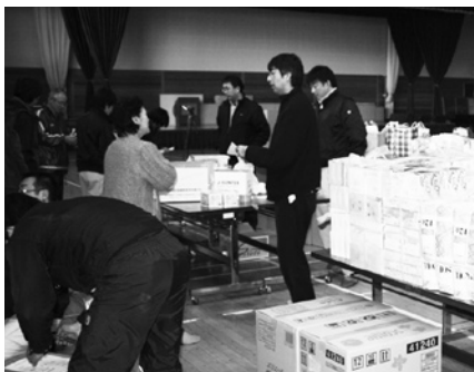
支援物資受付の様子