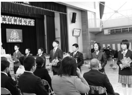
清水頭小学校の卒業児童

間の思い出と保護者や先生、地域の方々への感謝の思いを胸に、「思いやりのあるたくましい中学生になる」と誓いました。