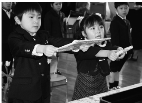
田子幼稚園の卒園児

●3月17日、田子幼稚園で平成22年度卒園式が行われ、8人（男子5人、女子3人）の園児が卒園証書を授与され、「お別れの詞」で楽しかった幼稚園の思い出を発表し、お父さんやお母さんに感謝の気持ちを伝