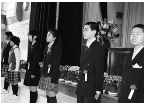
上郷小学校の卒業児童

●3月18日、上郷小学校で、平成22年度卒業証書授与式が行われ、6人（男子2人、女子4人）に卒業証書が授与されました。卒業生は、「門出のことば」で、6年