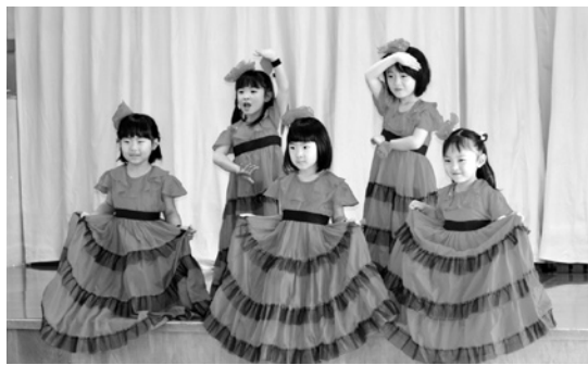
月組の女の子による「ちょうのフラメンコ」

発表の合間には園長先生から、「園児の人数が少なくなっているので、全員と一緒にできるオペレッタなどを取り入れてみました。年長組が年下の子に優しく、3歳児も上の子の行動を見て覚えていきます。田子幼稚園は少人数の良さを生かしていきます」とあいさつを述べました。