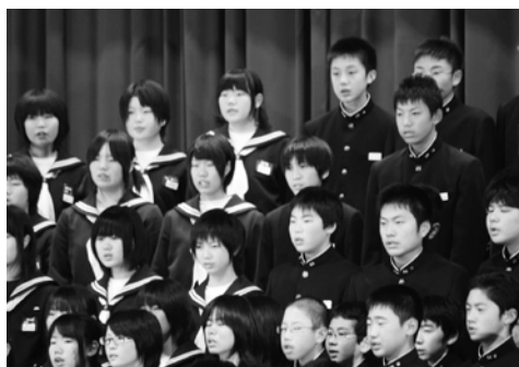
田子中の全校合唱「心の中にきらめいて」