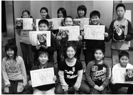
昨年度スポーツ奨励賞を受賞したみなさん