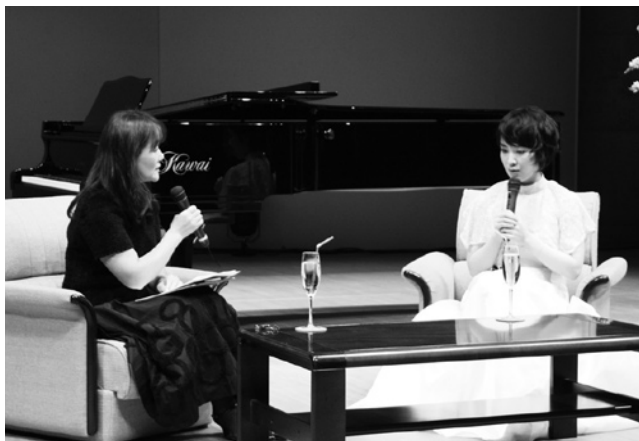
貴重なお話を聞いたトークコーナー

また、受付ロビーでは、東日本大震災被災地への義援金を募りました。来場者の善意により集められた募金額は、80,453円でした。この義援金は、日本赤十字社田子町分区及び青森県支部を通じ日本赤十字社へ送られ、被災した市町村へ分配されます。