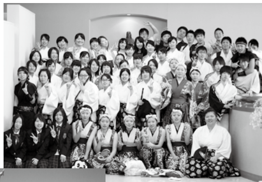
最優秀賞に輝いた郷土芸能部