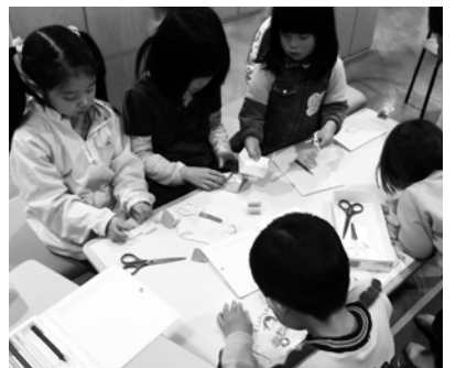
上手にできるかな～

▼対象 小学校低学年までのお子さんと保護者の方 ▼日時 12月10日(土) 午前