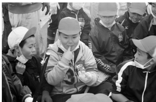
搾りたてのじゅうねの味は？

児童らは、竹の棒で叩いたり、枝と枝をぶつけ合ったり、実を振り落とし、ふるいや唐箕（とうみ）を使って枝や細かい殻などを取り除きました。脱穀の後には油搾りの様子を観察し、搾り