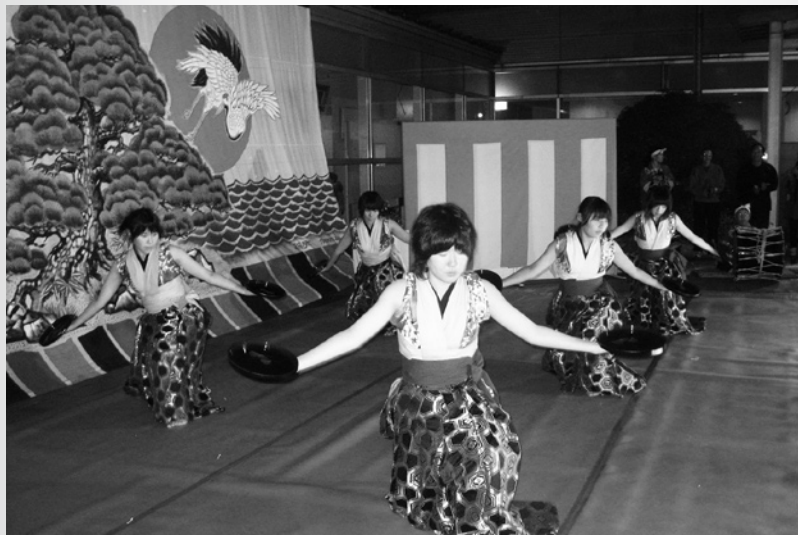
盆舞を披露する受講生