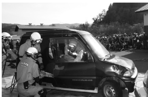
ドアをこじ開け、救助訓練を行う消防署員

11月1日、上郷公民館周辺で総合防災訓練が行われました。町内で震度6弱の地震が発生し、土砂崩れや火災、車両事故が起きたという想定で訓練が実施されました。訓練には、各消防団や三戸警察署、赤十字奉仕団など11機関が参加し、それぞれ給食・給水訓練や初期消火訓練など、自分たちの役割を遂行しました。