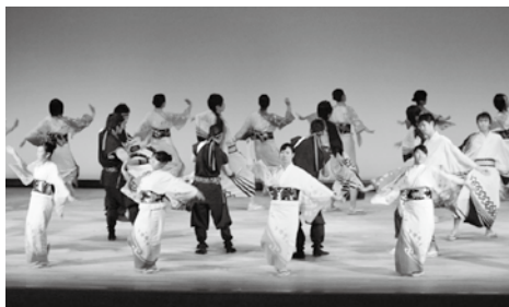
観客を魅了した「ナニヤドヤラ」

10月29日から31日まで、中央公民館や農業者トレーニングセンター等を会場に、第46回田子町文化祭が開催されました。公民館では、子ども会の屋台や田子のむかし話、知足会によるお茶会などが行われました。田子のむかし話では、長坂集落が舞台となっている「ぬのがらみ」や、関の洞圓寺入口の地蔵にまつわる「石地藏物語」が紙芝居で披露されました。また、農業者トレーニングセンターでは三戸消防署田子分署による消防展や、児童生徒らによる絵画や習字、高齢者による陶芸や俳句といった多くの作品が展示され、来場者にぎわいました。