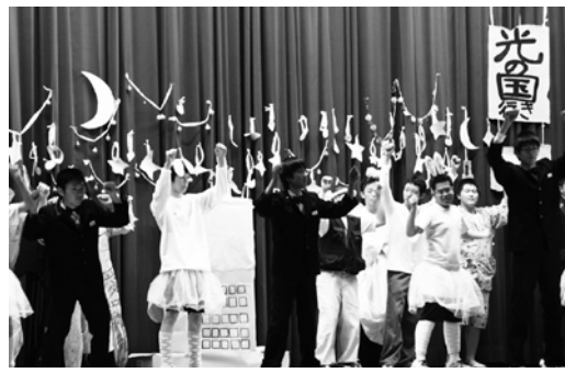
文化祭を盛り上げた劇「夢から醒めた夢」

した。4回目の開催となる今回は、町内外から約70名が参加しました。参加者は、関やすらぎの駐車帯からみろくの滝まで歩き昼食を済ませ、その後、駐車帯まで戻る約15キロのコースを各自のペースで歩きました。今回で3回目という八戸市からの参加者は「バイキング形式のお昼ご飯が豪華でうれしかった。来年もまた参加したい」と満足そうに話していました。