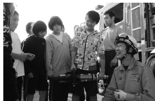
救助機器を持ち上げる上郷小の児童

救助救出訓練では、油圧式スプレッターを使って事故車両の扉をこじ開け、中の人を救助する消防署員の姿に、参加者らは見入っていました。