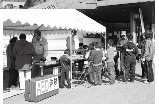
→ 子どもたちにマスコットを配り、防災を呼びかける消防署員

10月29日から31日まで、中央公民館や農業者トレーニングセンター等を会場に、第46回田子町文化祭が開催されました。公民館では、子ども会の屋台や田子のむかし話、知足会によるお茶会などが行われました。田子のむかし話では、長坂集落が舞台となっている「ぬのがらみ」や、関の洞圓寺入口の地蔵にまつわる「石地藏物語」が紙芝居で披露されました。また、農業者トレーニングセンターでは三戸消防署田子分署による消防展や、児童生徒らによる絵画や習字、高齢者による陶芸や俳句といった多くの作品が展示され、来場者にぎわいました。