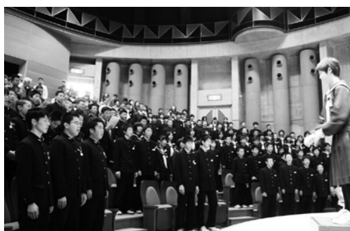
オープニングの全校合唱

田子中合唱コンクール 10月16日、タプロコピアンプラザホールで平成23年度田子中学校校内合唱コンクールが行われました。生徒らは客席いっぱいに詰めかけた来場者の前で、課題曲である「心の中にきらめいて」と、各クラスごとの自由曲を披露しました。 また、合唱の前には、コンクールにかける意気込みや当日までの練習過程がアウンスされました。どのクラスも初めはまとまらずに苦労していたようですが、