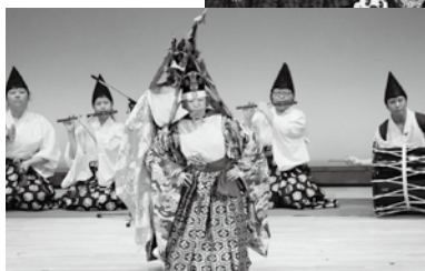
「鶏舞」を優雅に舞う生徒

快挙！ 田子高校が4連覇達成 10月30日、青森市で開催された第32回青森県高校総合文化祭郷土芸能部門で、田子高校郷土芸能部が4年連続6度目の最優秀賞に輝きました。これにより、来年8月に富山県で開催される第36回全国高等学校総合文化祭への出場権を得ました。