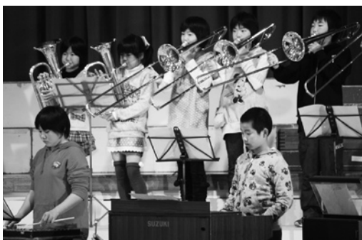
清水頭小の児童による合奏「勇気100%」

11月4日、田子中学校で田子町小中高合同音楽祭が行われました。2部構成の第1部では、小学生による