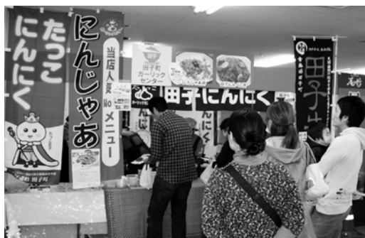
田子町のブースに並ぶ来場者