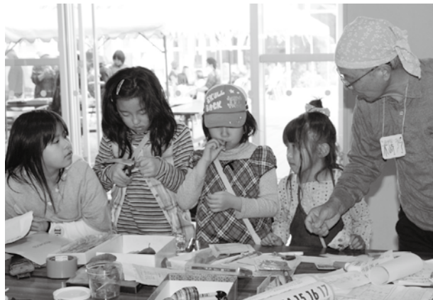
← 笛作り体験をする子どもたち。なかなかうまく鳴りません