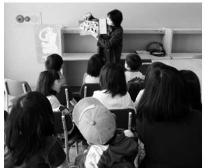
今日のお話は何だろう？

す。毎月第2・第4土曜日の午前中は、お子さんやお孫さんと一緒に、図書館で楽しいひとときを過ごしませんか？