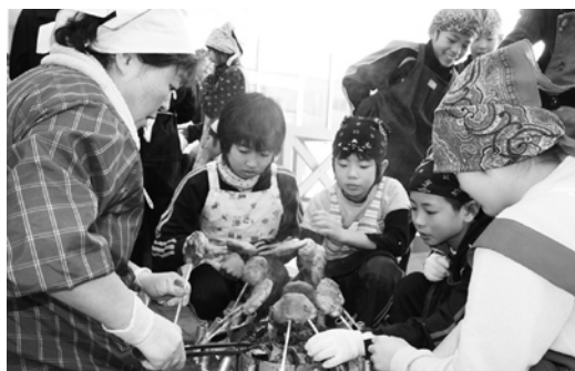
うまく焼けるかな？