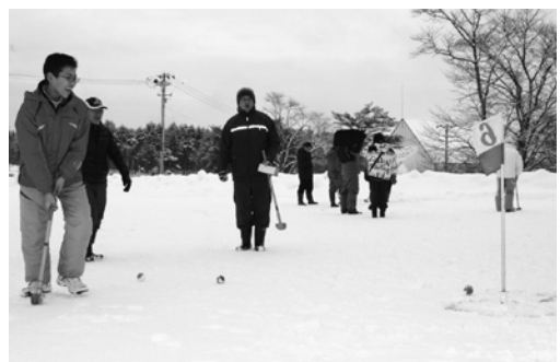
雪上グラウンドゴルフを楽しむ参加者