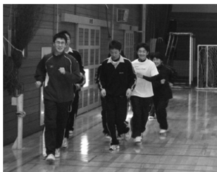
練習に取り組む選手

を中心に練習を行い、その後は、ランニングを中心に練習します。練習場所も八戸の砂浜等を活用して、心肺機能の強化も行います。選手が運動の基本となる「走る」を通して、心身ともに健康でたくましい子どもを育成します。