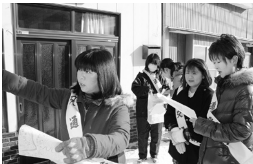
地図を手に訪問してまわる母の会会員

その後の報告会では、「道路が狭くて歩くのが大変だった」などの各自が気づいた点を報告し、町の安全について話し合いました。