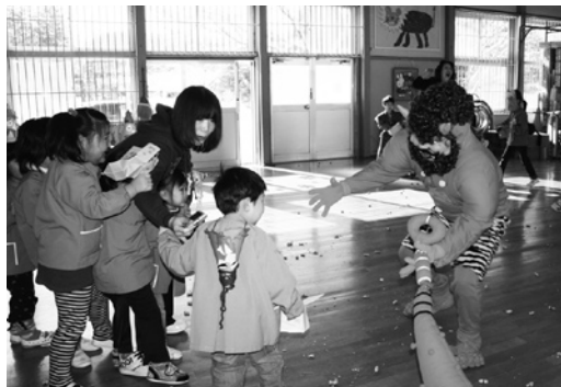
全力で鬼から逃げました（田子幼稚園）

2月4日と5日、石亀地区研修センターでコミュニティ冬まつりが行われました。これは、行事の少ない冬の期間にまつりを行い地域住民の方を元気づけようと、石亀地区コミュニティ推進協議会が企画したものです。