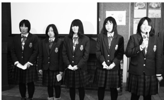
報告をする研修生たち

「田子町」をご支援いただき誠にありがとうございました。 問 役場町民課税務グループ ☎20-7112