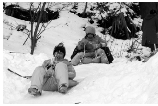
夢中になってそり遊びをする子どもたち

また夜には、国道沿いの鳥居から研修センターにかけて設置した50個あまりの雪灯籠に火が灯され、淡い光に包まれた幻想的な雰囲気の中で、澄んだ夜空