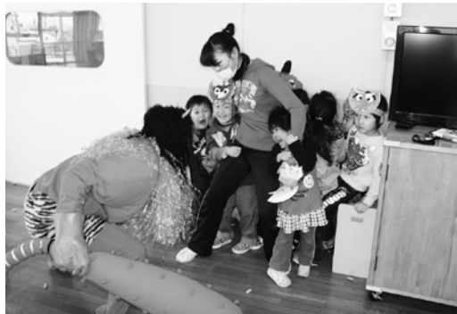
鬼におびえ、先生のお尻に隠れる園児たち（田子保育園）