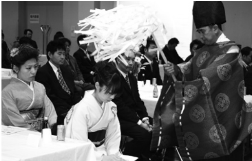
厄祓いを受ける出席者

ールで平成24年田子町合同厄祓祭が行われました。これは、町合同厄祓祭実行委員会の主催で行われ、大厄を迎える男女約60名が神事に出席しました。