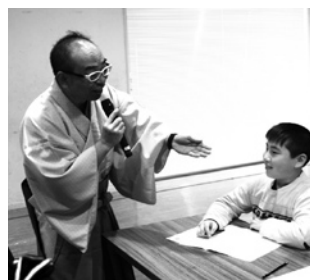
夢をたずねる林家さん

成人式を特集しました。新成人の思いは、式で配布された成人宣言の冊子からの転載です。それを見ると、「大人としての自覚を持つ」「しっかりとした大人になる」という内容が多く、具体的に夢や目標を書いている人が少なく感じました。今回は書かなかったのかも知れませんが、実際に夢を見つけていない人が多いのであれば、1月29日に開催された生涯学習町民研修会はピッタリのテーマだったと思います。講師の林家さんが「夢がないということは、夢を持つという夢がある」と話していたのが印象に残っています。今はまだ夢を持ってなくても、「夢を持つ夢」に向かってまい進してほしいと思います。(広報担当 H・S)