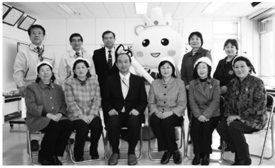
たっこ王子と一緒に記念撮影

い」「文化の違いに驚いた」など、一人ひとり研修で感じたことや学んだことを述べました。