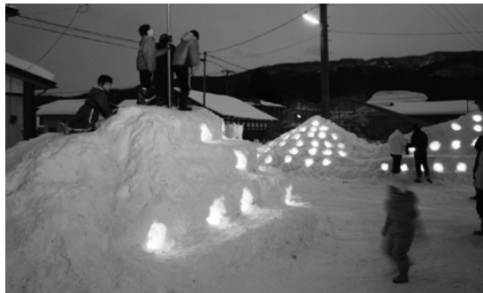
子どもたちも大喜びの雪灯籠

スキー協会主催のナイタースキー教室や町スノーボード協会主催の初心者講習会などが行われ、参加者は楽しみながら体力や技術の向上を目指していました。