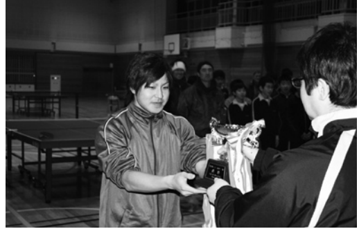
優勝杯を返還する熟年オールスターズの選手

1月19日、農業者トレーニングセンターで第35回ナイター卓球リーグ戦開会式が行われました。はじめに、昨年優勝チームの熟年オール