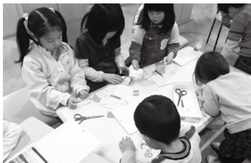
子どもたちに人気の「としよかんクラブ」