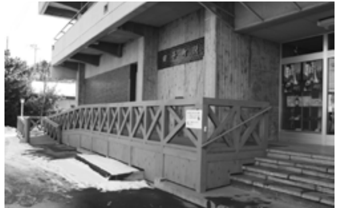
どうぞご利用ください