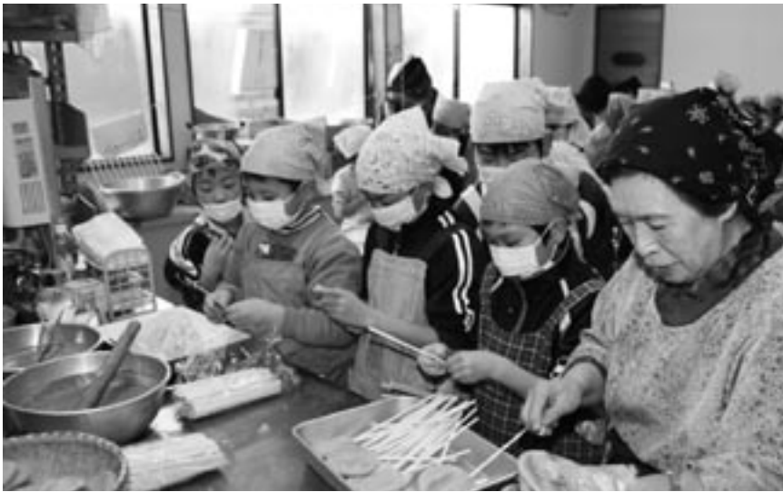
串餅に上手に割りばし差せるかな？

1月7日、清水頭小学校で「じゅうねみそ串餅づくり」が行われました。これは自分たちで収穫した作物を使って伝統料理を作ることで、郷土の伝統料理を知り、伝承することへの興味、関心を持つことを目的に行われたものです。清水頭小学校の児童15人と婦人会、じゅうねの会が参加して行