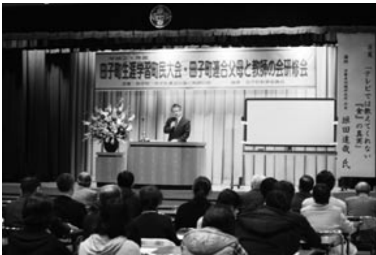
熱心に講演に聞き入る参加者たち

1月24日、中央公民館で「平成21年度田子町生涯学習町民大会・田子町連合父母と教師の会研修会」が開催されました。これは、子どもたちが豊かな人間性を