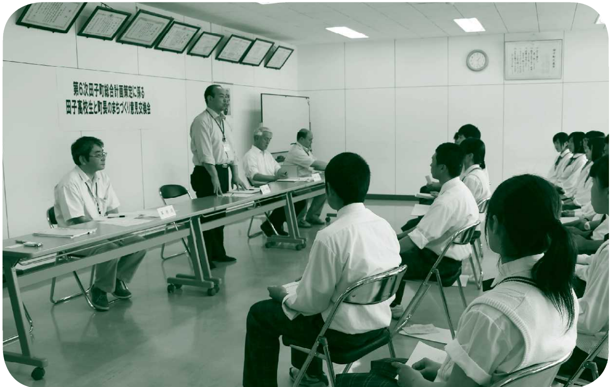
田子高校生と町長のまちづくり意見交換会(H27.07.06)