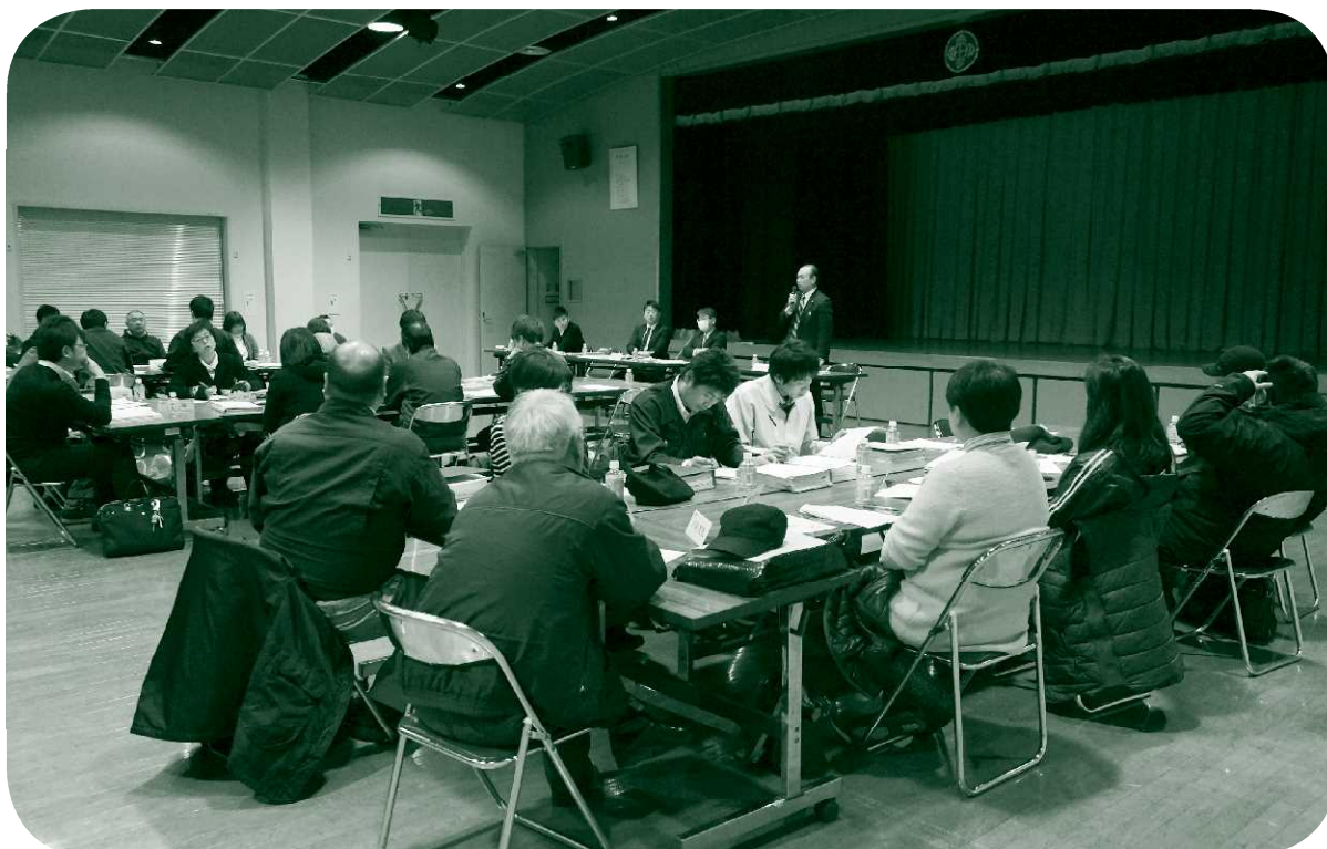
専門部会・庁内プロジェクトチーム合同全体会議(H27.03.12)