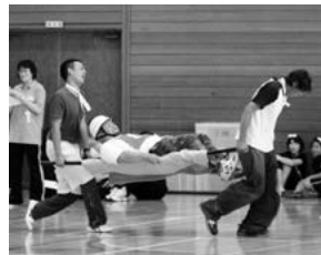
チーム対抗担架リレー