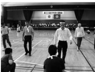
田子No.1決定戦(センス)