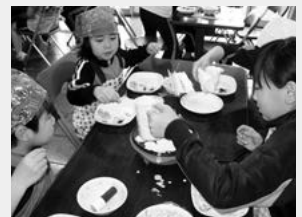
わんぱくじゅくの様子