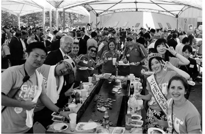
ギルロイ市からのゲスト

10月1日・2日、大黒森229ドーム周辺で第31回「にんにくとべごまつり」が開催されました。今回から、屋外バーベキュースペースに大型テントが3基追加され、急な悪天候にも対応できるようにになりました。