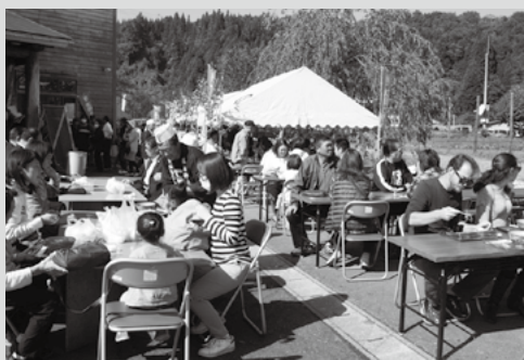
(写真8) 搗きたてのそばを味わう来場者