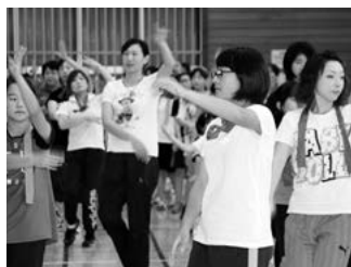
フィナーレ(盆踊り)