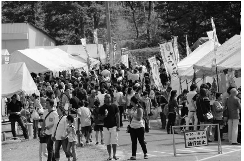
にぎわった出店会場

市と韓国・瑞山市からのゲストの他、千葉県多古町や神奈川県真鶴町、北海道厚沢部町からも関係者が来町し一緒に祭りを楽しみました。