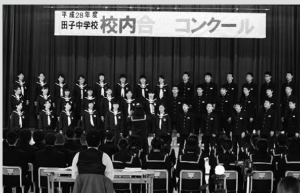
(写真6) 最優秀賞に輝いた31A