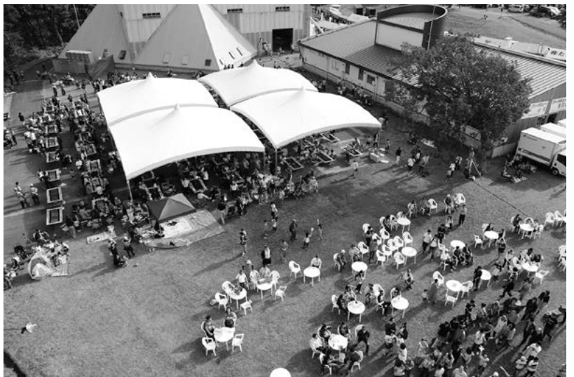
上から見た会場の様子

ステージでは、園児らの元気いっぴいなダンスや、田子牛やにんにく加工品が当たる「田子まるごと抽選会」、にんにくを吹き飛ばし飛距離を競う「世界にんにく飛ばし大会」、的を狙ってにんにくを吹き飛ばす「にんにく射的」など来場者参加型イベントの他、