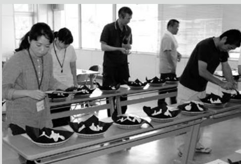
(写真4) 基準に沿っているか審査