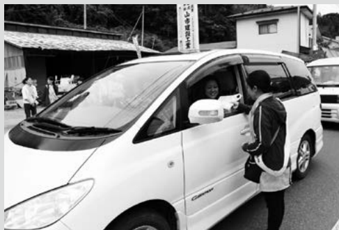
(写真③) 街頭活動の様子