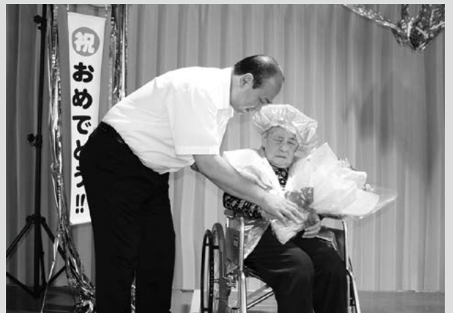
(写真1) 町長から祝い金と花束が贈呈