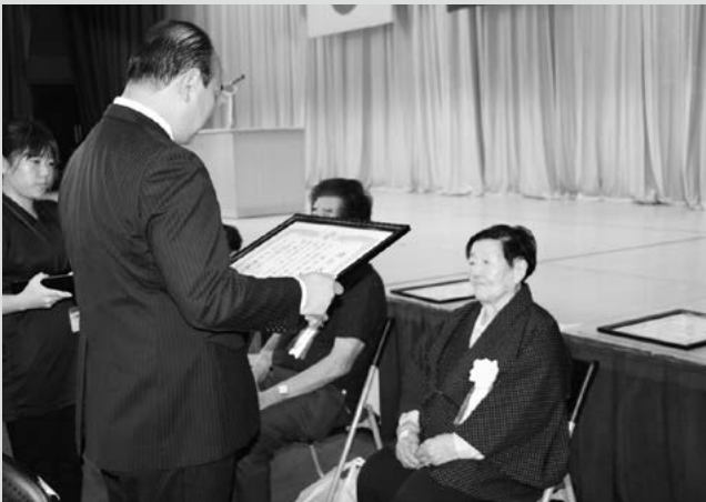
(写真2) 顕彰状の受賞者