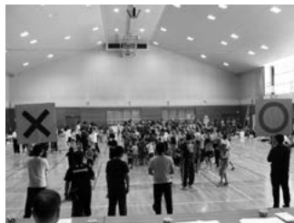
田子No.1決定戦(ウルトラクイズ)