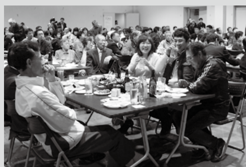
(写真7) 限定ビールを堪能