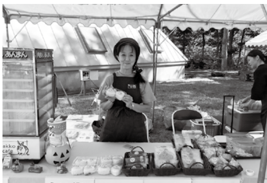
たっこまち地域おこし協力隊☆活動録

最近の私は、日々のTakko cafeの営業と、イベント出店をすることが増えました。今まで田子に来ることのなかった二戸や八戸の方にTakko cafeを知っていただく良い機会だと思っています。出店に行くとcafeが臨時休業になるので困りますが、月に何日か週末もお休みをいただき田子町のイベントでも出店をしています。べごまつりでも、Takko cafeクラブの仲間と一緒に出店をしましたが、夏のように暑い2日間だったので、私の作ったほかほか中華まんよりも、クラブで出品したデトックスウォーターに行列ができる繁盛ぶりで驚きました。美と健康を気にする方はとても多いようです。これからも美と健康に関するものづくりをしていきたいです。