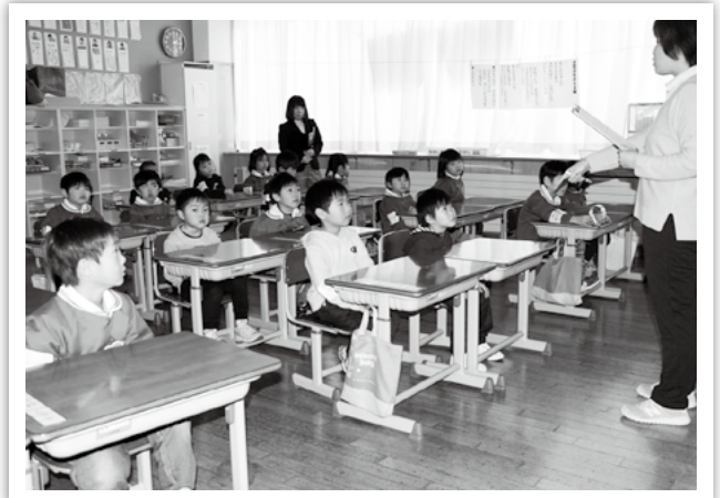
田子小：少し緊張した面持ち