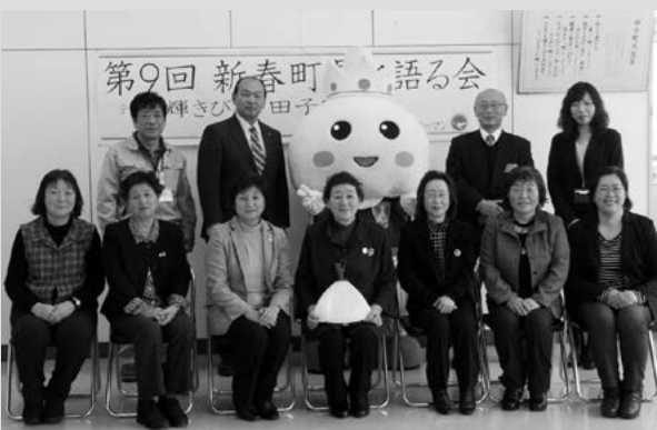
(写真9) たっこ王子とVicウーマンの方々