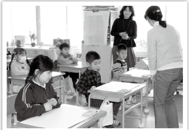
上郷小：お絵かきタイム