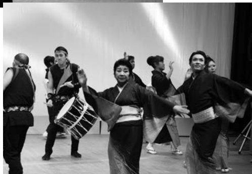
田子町ナニヤドヤラ保存会