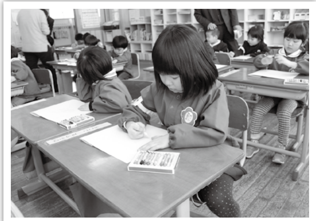
田子小：自分の顔と名前を書く園児