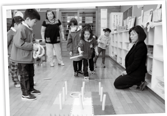
清水頭小：みんなで輪投げ