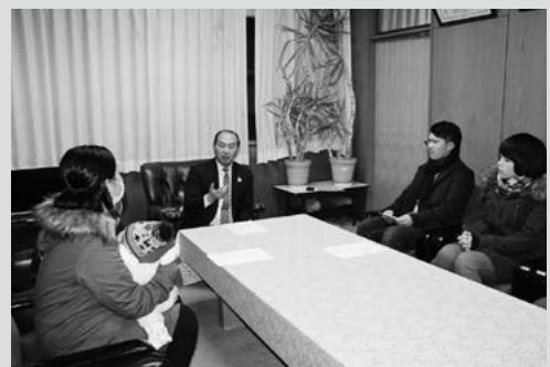
(写真1) 対象となったご夫婦