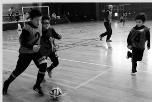
(写真8) 相手をかわしてボールをつなぐ