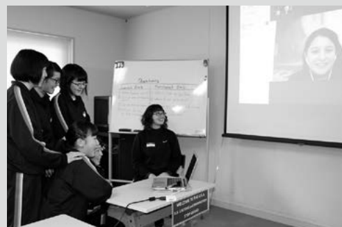
(写真6) インターネット電話でアメリカとつながる