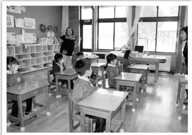
清水頭小：名前を呼ばれて大きな返事