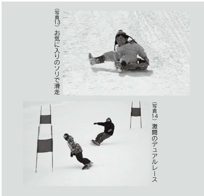
(写真13) お気に入りのソリで滑走

デュアルレースや雪山宝探しなど、会場はにぎわいを見せました。ソリランドでは、スノーボード協会が様々なタイプのソリの試乗をしており、子どもたちがお気に入りのソリ探しに夢中になっていました。また、229ドームに屋台村が特設され、温かい食べ物で来場者らを迎えました。夕方、スキーセンター前の子どもたちが作った雪灯籠の灯りがきれいに灯る頃、冬の夜空に火花が打ち上げられ、来場者らを魅了しました。