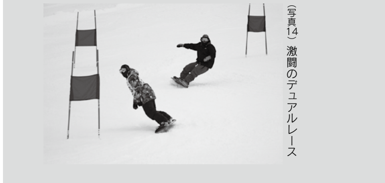
(写真14) 激闘のデュアルレース