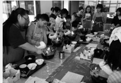
第1弾「ぐりとぐら」のパンケーキ時のようす