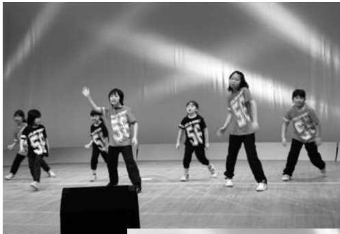
アツシ School (特別出演)