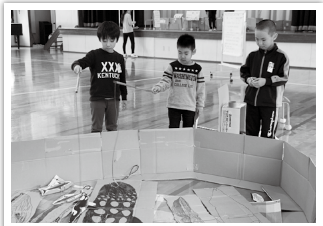
上郷小：お兄さんたちが作った魚釣りゲーム