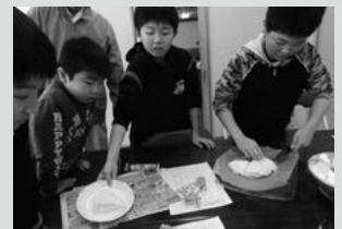
ミルクレープ制作中!(1月)