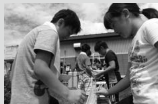
みんな大好き流しそうめん!(8月)