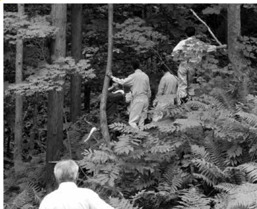
山中にある水源地进行調査

新水源地及び上水道の整備を行うことにより、これまでの新遠瀬水系（遠瀬・道前・道地まで給水）及び新田水系（新田のみ給水）