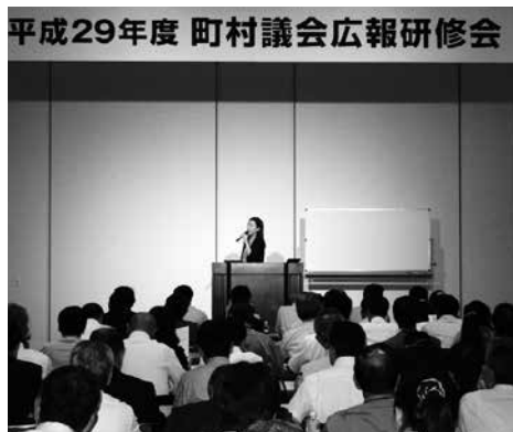
多数の議員が参加した研修会

9月28日、東京都千代田区にある砂防会館にて開催された、「町村議会広報研修会」に広報委員長として参加して参りました。