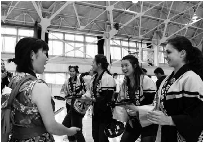
田子高校生とギルロイ市高校生の交流

英語力の強化は国全体の要請となりつつある。幸い当町は、ギルロイ市との長い交流を持ち、日頃から英語に接する機会を多く持つていると思う。今後、町国際交流協会などの団体の協力を得ながら、様々な事業の制度や仕組みを活用した取り組みができないものか、英語塾の調査研究をしていきたいと思っている。