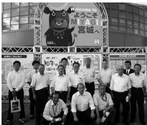
全国和牛能力共進会を視察

産業の威信をかけた大会です。当組合管内畜産農家からは、田子町より6頭、三戸町より11頭が上位入賞を目指し、審査に臨みました。