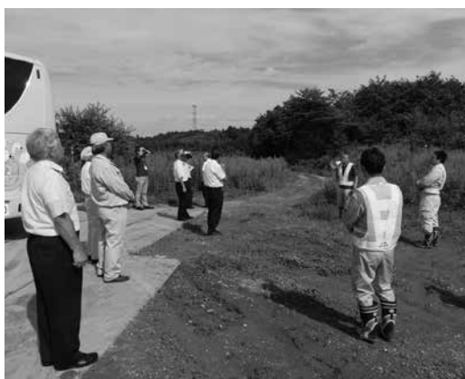
産廃不法投棄現場跡地を現地調査

この地方にあった漆を選んだことに感心し、何とか上手くいって欲しいと思った。 (欠端則夫)