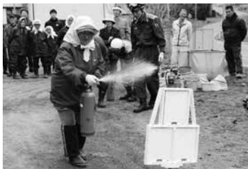
清水頭自主防災組織の 防災訓練