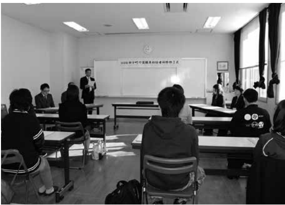
平成28年度介護職員初任者研修修了式の様子

入所者数は21人。技能 職の従事者数は、医師 2名、理学療法士1名、 作業療法士1名、看護 職員7名、介護職員7 名、栄養士1名、介護 支援専門員1名。従事 者の不足者数は、常勤 の方で夜勤の可能な介 護職員を2名程度確保 できれば、本来の入所 者数を確保することが 可能になる。