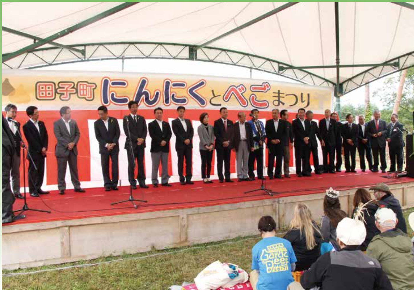
近隣市町村の議長も来場したにんにくとべごまつり