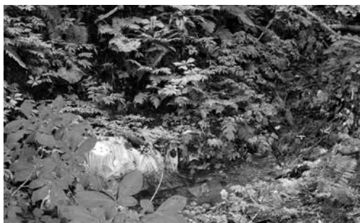
給水設備設置予定地

す。施設整備により、より安全な水道水の供給が可能となります。調査した水源地は、新田から花木ダム方面