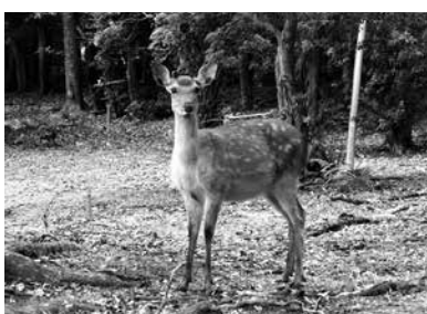
農作物被害が心配されるニホンジカ

当町でニホンジカに よる農作物被害の発生 はないが、センサーカ メラを使用し、引き続 き調査を進めるととも に、県や猟友会と連携 し、今後の農作物被害 に備え、オリ等の導入 について検討する。