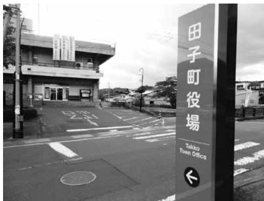
役場前に設置された公共サイン