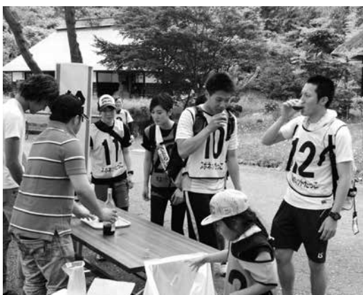
創遊村で行われたグルメマラソン