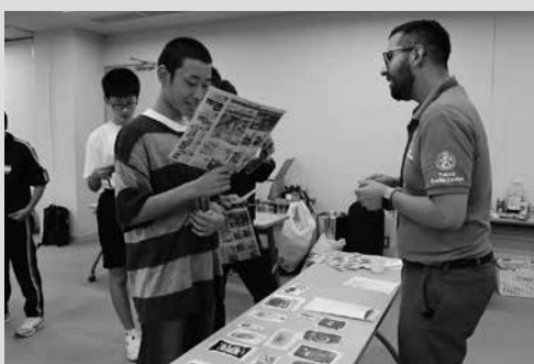
(写真3) アメリカのスーパーマーケットのチラシを使って買物の練習