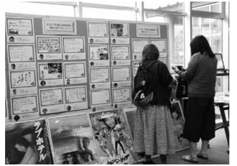
寄せられたメッセージの数々