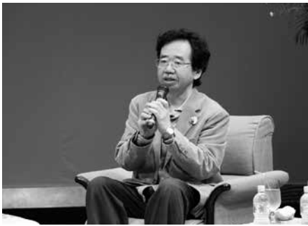
映画学者の木村准教授