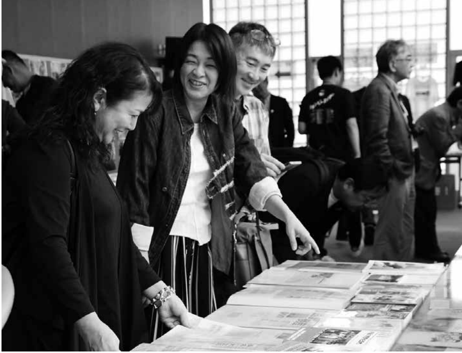
映画パンフレットや資料を見て思い出を語るゲスト方