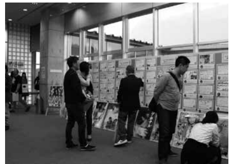
ポスターや貴重な資料に見入る来場者ら