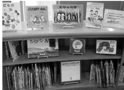
子どもコーナーの向かい側、ソファの近くにある「子育て支援コーナー」