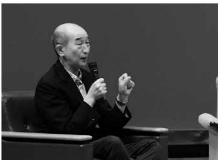
聞き手の榎戸監督(上)と富樫監督(下)