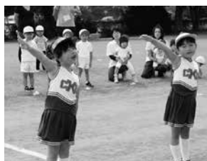
かわいい選手宣誓(上郷保育園)