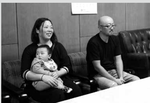
(写真2) 対象となられたご夫婦