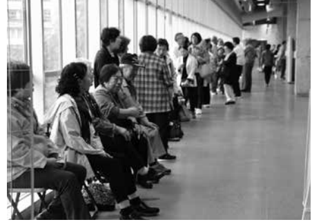
開場を待つ来場者