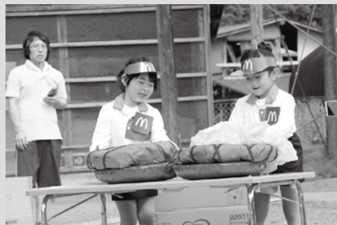
(写真⑧) 注文通り作れるかな？