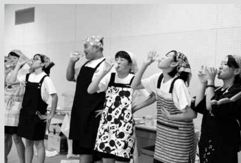
(写真6) 赤ちゃんの顔を思い出して