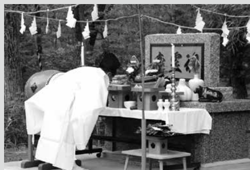
(写真6) これまでの安全に感謝