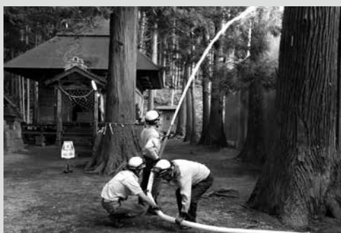
(写真2) 地域住民による消火訓練