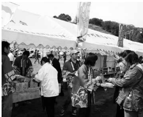
多古町からの出店ブース