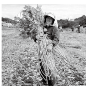
じゅねの収穫をお手伝いさせていただいた時。こうなる立派な農家のような格好で自分でもビックリ。