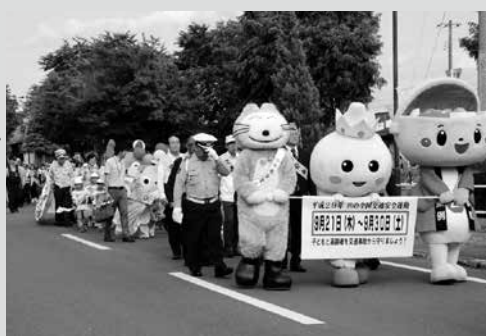
(写真4) 街頭パレードの様子