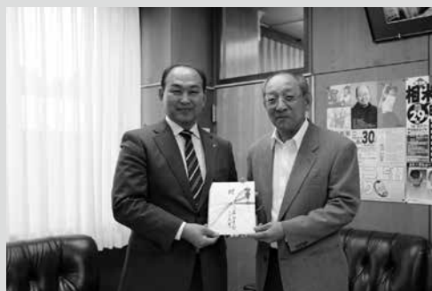
(写真9) 目録を手渡す松橋支部長(右)