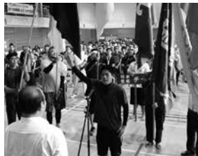
選手宣誓 石亀チーム