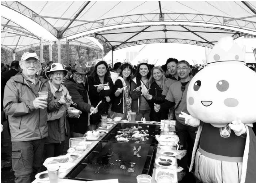
ギルロイ市からのゲスト

き飛ばす「にんにく射的」など来場者参加型イベントの他、音楽ライブ、ダンスパフォーマンスなどで大いに盛り上がりました。 出店ブースでは昨年に引き続き、多古町、階上町、野田村、鹿角市が地域ごとの特産品を販売して地域をPRしました。また、今年の千人鍋は田子町相撲協会が販売し、直径1・2mの大鍋を使用して「田子町相撲協会のちゃんこ」を振る舞いました。