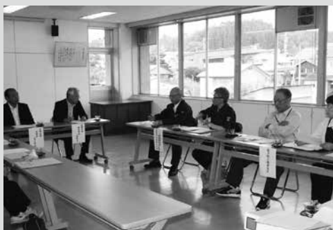
(写真7) 対策本部会議の様子