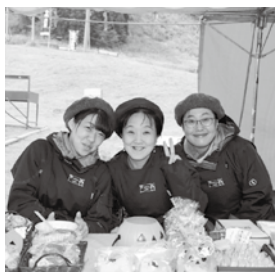
今年のべごまつりには、いつも1人で大変だろうとTakko cafeのお手伝いに関東から2人も来てくれました。田子町を好きになった方が、はるばる来てくれるのは素晴らしいことだと思います。