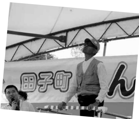
にんにくを飛ばしに静岡県磐田市から参加