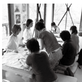
Takko cafe でのワークショップの場面。定期的に先生をお呼びして開催していて、ケーキ教室などもあります。毎回色々な人が集まり、交流の場所となっています。

ゴールデンウィークには友人が集合して、こんなポーズで写真を撮りました。友人が友人を呼んで、交流の輪が広がっています。