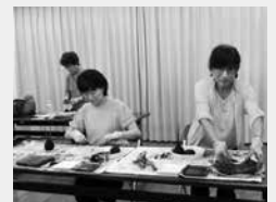
8月のアレンジ 苔玉づくり