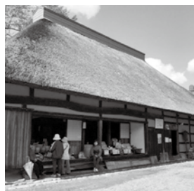
2回目のタップコマルシエの様子。茅葺屋根と晴天の中でのイベントは最高。町内に素敵な施設があるのに、使われないのはもったいない。これからもマルシエに限らず、活用してほしいと思います。