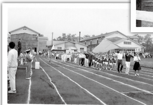
←町民運動会 (会場：田子小学校)