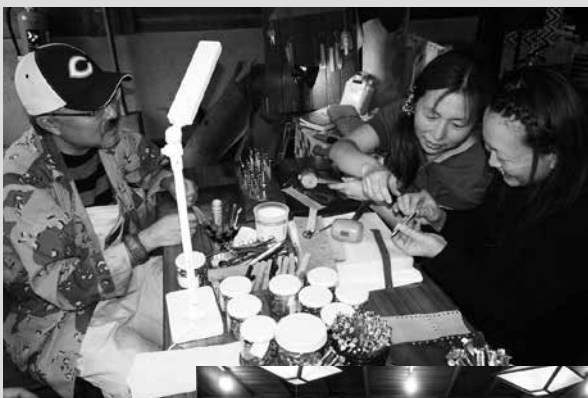
(写真6) レザークラフトの体験をする来場者