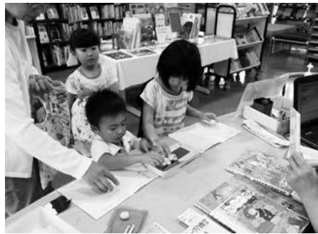
スタンプ楽しい読書マラソン