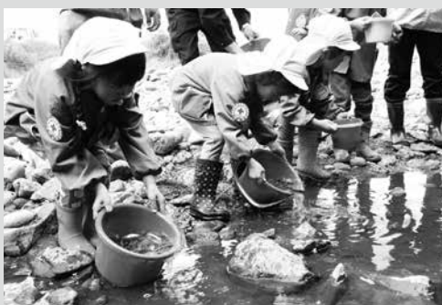
(写真2) あゆの稚魚を放流する園児たち