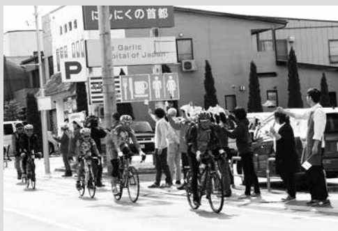
(写真4) フェザン通りで声援を受けながら走る