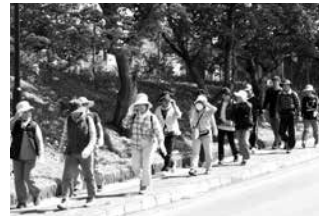
5月「ほそののルート」