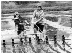
田植定規で印付け (上郷小)