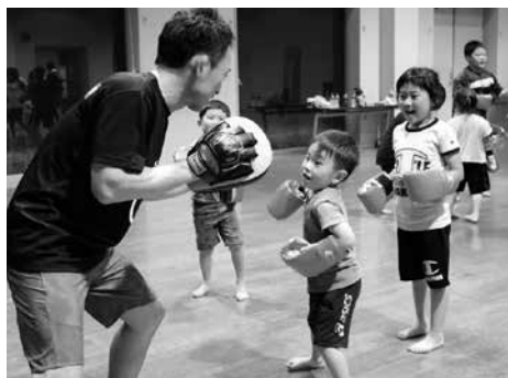
親子で汗を流す(ストライキングエクササイズ)