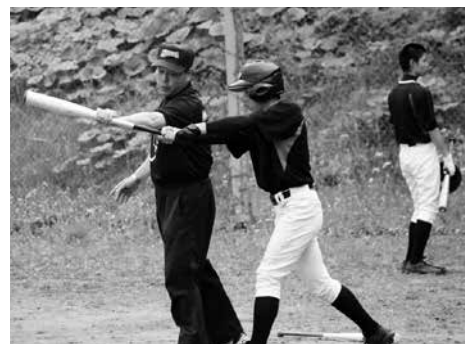
山下氏からのバッティング指導