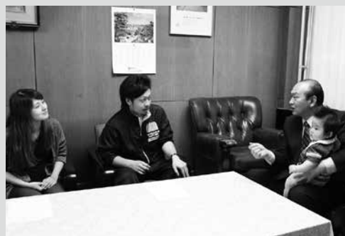
(写真3) 町長と対象となったご夫婦