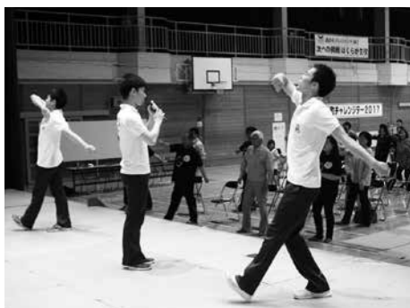
青森大学新体操部員からのレクチャー