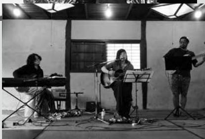
(写真7) meguさんのライブの様子