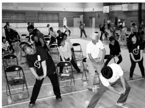
参加者全員で元気あつがる体操