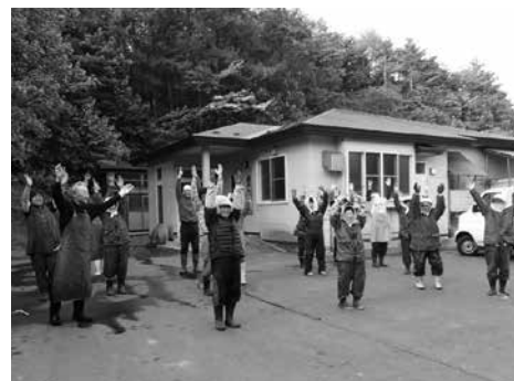
袖平自治会の様子