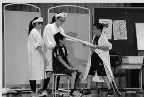
（写真6）田子小「はりきり医者」がやってきた