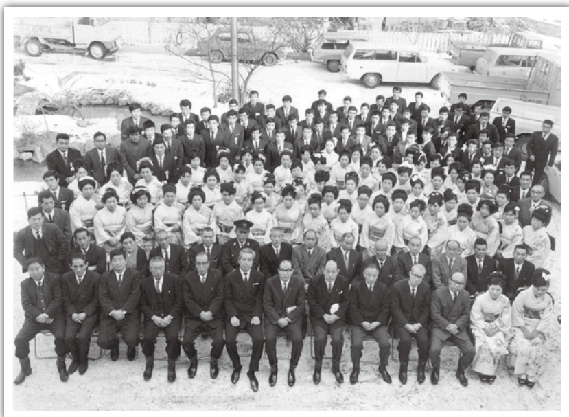
成人式 1968年頃の写真です。場所の詳細は分かりませんが、斬新なアングルに目を奪われる1枚です。

今月号では、「にんにくとべごまつり」を取材しました。天気がいとは言えなかったものの、訪れたたくさんの方々の来場者の数に驚きました。会場内を歩き、取材した中でも、パイロシェフのステージはより一層盛り上がりを見せていました。カラマリの調理に観客が沸くのはもちろんですが、シェフ2名の調理以外のパフォーマンスでも注目を浴びていました。かかっている曲に合わせてエアギターをしたり、フライパンの柄の部分を見立てて歌ったり……そこはまるで彼らのライブ会場のようでした。ギャラリもそれに引き込まれ拍手をし、パフォーマンス終了後はカラマリの味を堪能していました。私も食べましたが、あれはもう一度食べたくなる味です。今度はいつ来てくださるのか楽しみです。