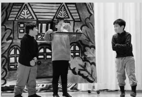
（写真5）清水頭小「注文の多い料理店」