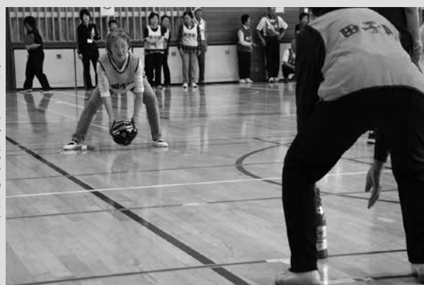
(写真1)ポウリング競争の様子