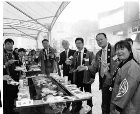
瑞山市からのゲスト