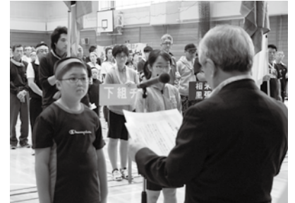
TAKKO 愛さつぐりッと標語表彰式

あいさつは、コミュニケーションの基本であり、あいさつを通して児童・生徒の公共心・社会性を育み、犯罪の抑止力を高める効果もあります。これらのことから、子どもたちを地域全体で育てる環境づくりの一環として、あいさつ運動を推進していきます。