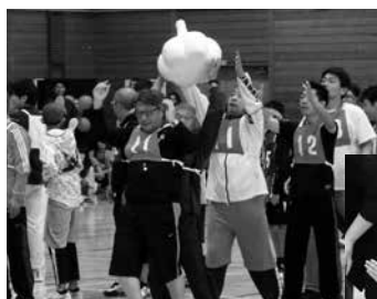
にんにく宅急便北側チーム