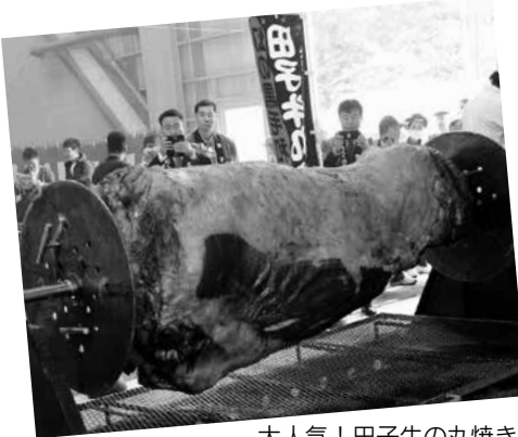
大人気！田子牛の丸焼き