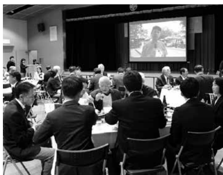
ゆかりある方からビデオメッセージ

同日、中央公民館で行われた姉妹都市合同歓迎会では、ゆかりのある方々のメッセージの展示や、アメリカの食文化体験コーナーが設けられた他、鏡開きによって30周年のお祝いをしました。