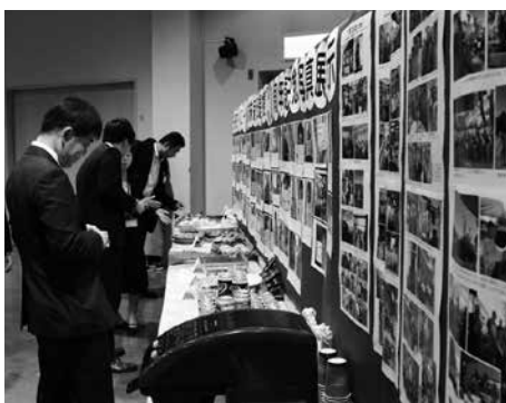
メッセージ展示と食文化体験コーナー