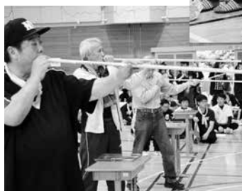
スポーツ吹矢を行う選手