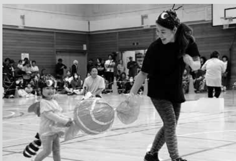
（写真3）1歳児うめ組親子競技「おつかいあいさん」