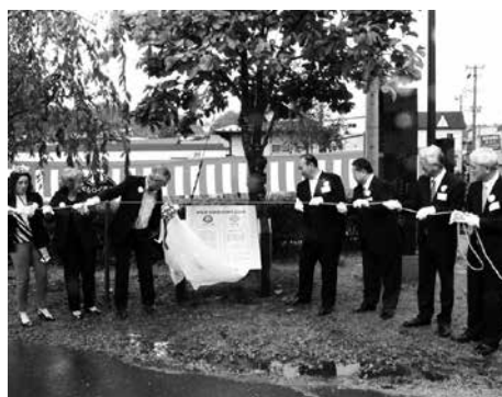
記念碑除幕の様子