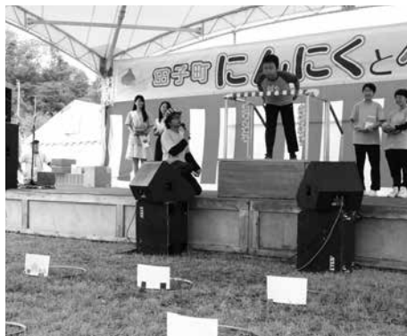
にんにく射的の様子