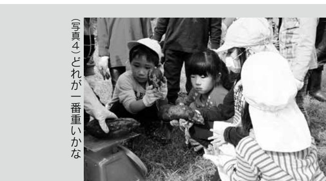
（写真4）それが一番重いか

10月6日、清水頭小学校で学習発表会が、田子小学校で学芸発表会が行われました。清水頭小学校では、5・6年生が鍵盤ハーモニカの演奏「静かにねむれ・こげよマイケル」に挑戦しました。3・4年生による劇「注文の多い料理店」では、山猫軒の奇妙な雰囲気が見事に演じられました。