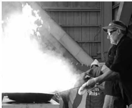
パイロシェフのパフォーマンス