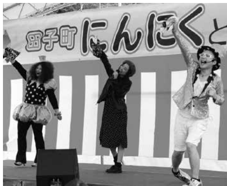
アンダーパスのステージ