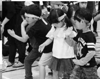
スタートを待つ 障害物レースの選手