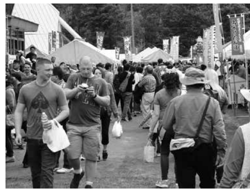
にぎわいを見せる出店ブース

地域ごとの特産品を販売して地域をPRしました。 また、今年、姉妹都市提携30周年を記念して、ギルロイ市から炎の料理人「パイロシェフ」が来町し、ギルロイガリリックフェスティバル名物料理の「カラマリ」（イカのにんにくたつぷりトマトソース炒め）の調理、パフォーマンスを披露しました。大きな炎を上げて大きなフライパンを振る姿に、来場者は歓声をあげていました。ガリリックフェスティバル名物料理を食べられるチャンスとあって、カラマリを求める長い列ができていました。 2日目はあいにくの雨模様となりましたが、両日合わせて約1万1000人の来場者が、たつこにんにくと田子牛を味わいました。