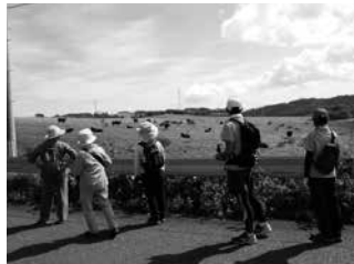
昨年健康ウォーキング