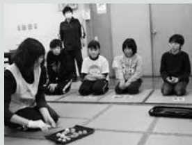
◎なんちゃって、ひな茶会! 最高に美味しい和菓子とお茶で「おしゅうございます」♪