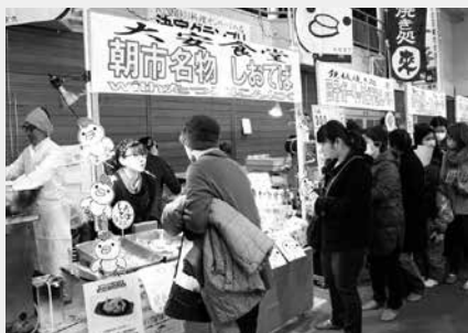
行列ができた 大安食堂のしおてば

八戸市や二戸市など、町内外から出店した8店舗がそれぞれ自慢のにんにく料理を出品しました。オンリー1の店は来場者によるメダルの投票で決められ、総重量2,530g分のメダルを獲得した、大安食堂のしおてば with たっこにんにくが2年連続のグランプリに輝きました。