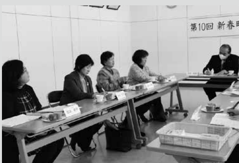
(写真5) Vic・ウーマンとの意見交換