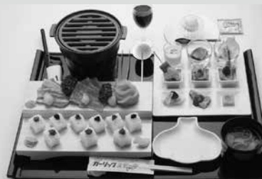
(写真10) リニューアルされるガリステごはん