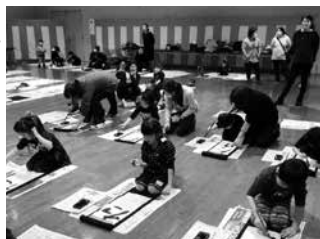
昨年書き初め大会