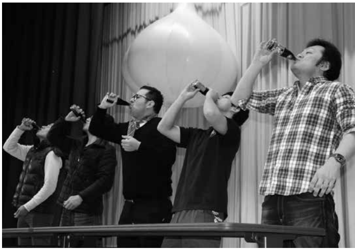
↑飲むならタッココーラ ジャッツ!5959 グランプリ

会場では、「牛すじ鍋」や「モツもつ鍋」など7種類の鍋料理や、たっこにんにくを使用したオリジナル料理の人気を競う「NINNIKU料理オンリー1グランプリ」といった料理出店のほか、田子町産の黒にんにく、酒まんじゅう、なべこだんご、まめしとぎなどの販売や田子高校郷土芸能部保護者会によるバザー、たっ