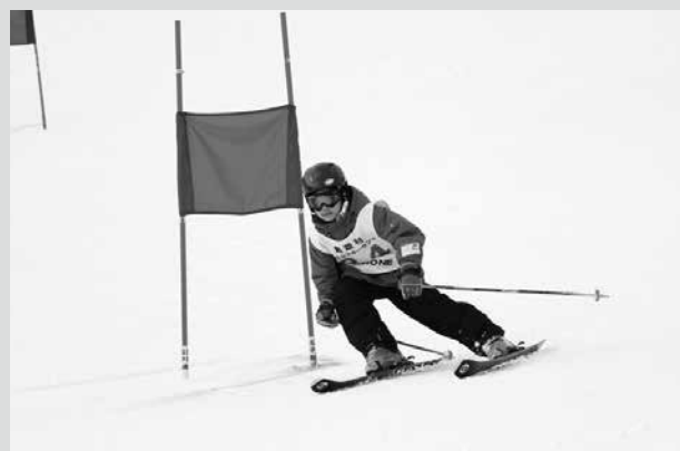
(写真1) 華麗なターンでコースを滑走

また、229ドームに屋根台村が特設され、温かい食べ物で来場者らを迎えました。夕方、スキーセンター前に子どもたちが作った雪灯籠の灯りがきれいに灯る頃、冬の夜空に火花が打ち上げられ、来場者らを魅了しました。