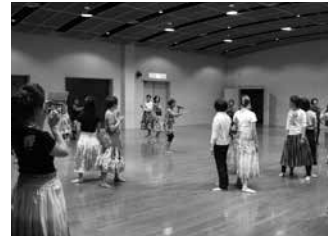
昨年フラダンス講座