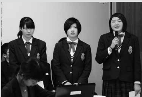
(写真4) 田子高校派遣団の発表