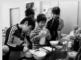
◎なんちゃって、フルーツポンチ! 自分だけのオリジナルフルーツポンチ! おかわりが止まらな〜い。