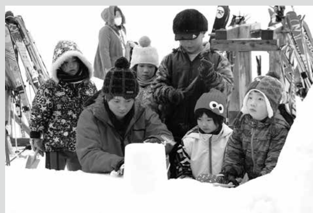
(写真2) 雪灯籠の作り方を教わる子どもたち