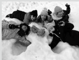
◎雪遊び中に穴掘り大会! なんということでしょう☆穴がつながって雪の洞窟で握手ができました♪

楽しかったこの1年。4月からは学年が1つ上がり、心も体も大人に近づいていきます。これからもすくすく館上郷分館をどうぞよろしくお願いたします。