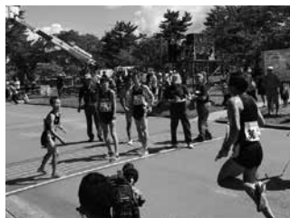
昨年駅伝競走大会