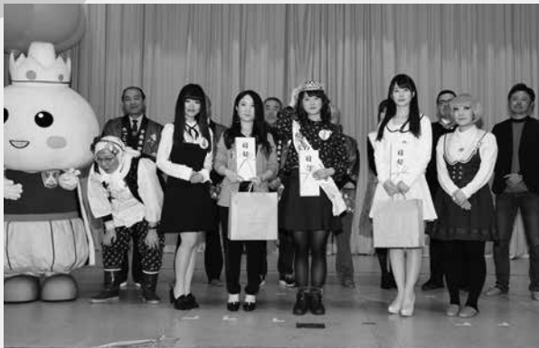
コンテスト出場者全員で記念写真

町内外から6名がエントリーし、応募の動機や意気込みを述べ、ガーリックレディにかかる思いをアピールしました。