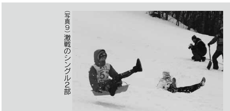
(写真9) 激戦のシングル2部