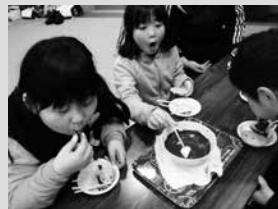
◎なんちゃって、チョコフォンデュ! 今日は、マシュマロと南部せんべい、りんごにバナナ……うまーい!!

上郷分館の子どもたちの良いところ...、それは『よく食べ、よく学び、よく遊ぶ』ところ! なんでも全力で怒ったり、泣いたり、笑ったり。今年の冬もいっぱい楽しんでくれました。