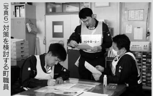
(写真6) 対策を検討する町職員