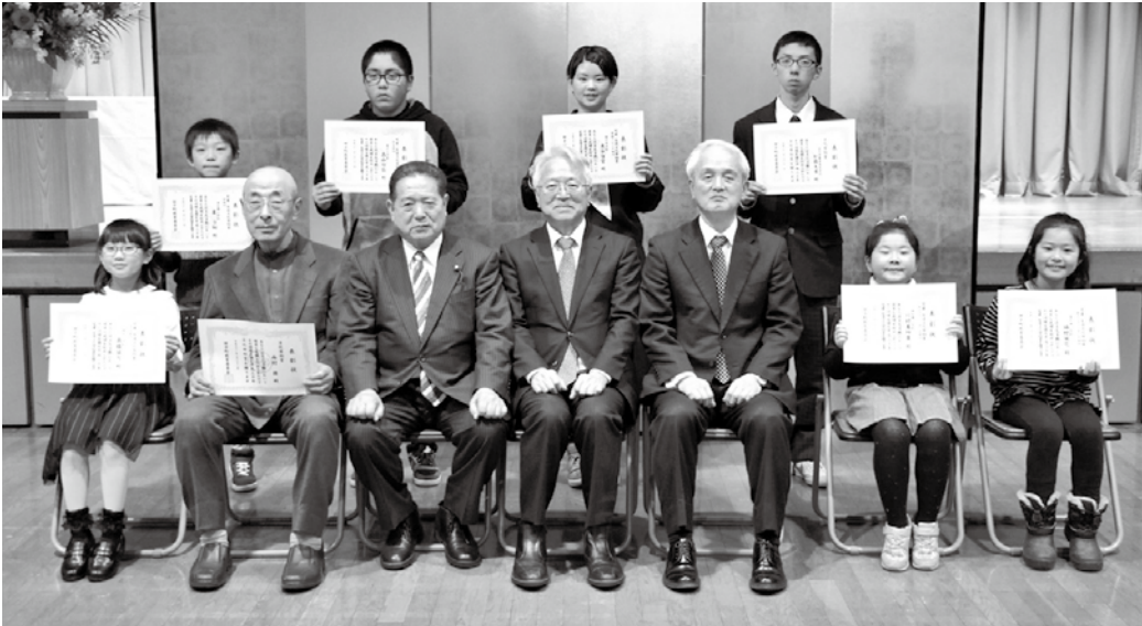
文化賞を受賞された方々

2月21日、中央公民館で平成30年田子町文化賞・スポーツ賞表彰式が行われました。結果は左記のとおりです。