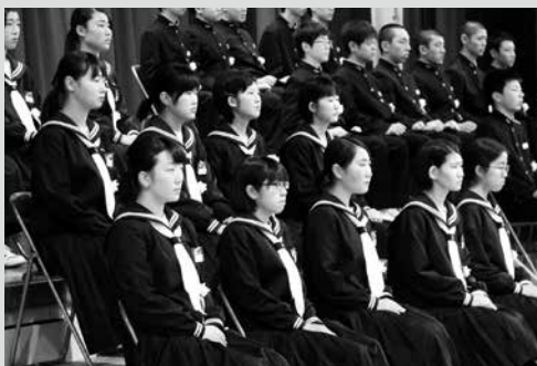
(写真7) 3年間の思い出を胸に