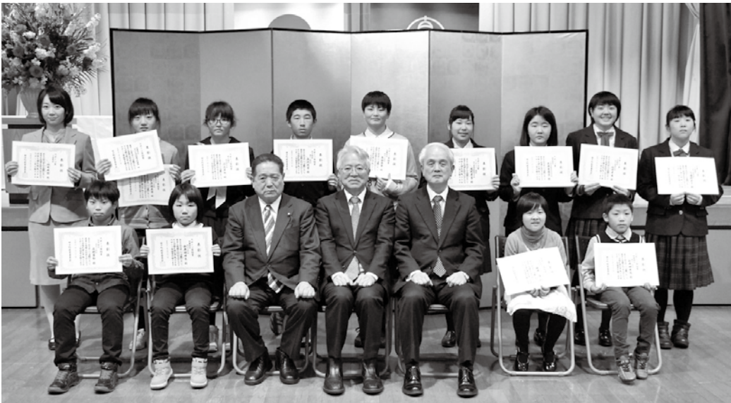
スポーツ賞を受賞された方々