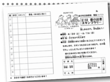
本を読んでスタンプを集めよう！

▼内容 期間中に図書館の本を1冊借りると、台紙にスタンプを1つ押します。スタンプを30個集めると、その場で粗品をプレゼントします。