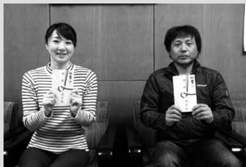
(写真6) 対象となった方々