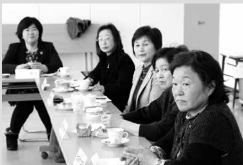
(写真3) 女性ならではの視点で