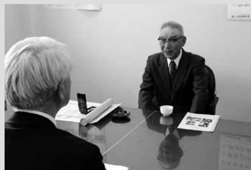
(写真4) 当時の思い出話に花が咲く

ありがとうございます 平成31年3月22日、町にゆかりがあつた故 若山喜一郎様(埼玉県久喜市)から、遺贈による寄付金99万9500円をいただきました。誠にありがとうございます。故 若山喜一郎様のご逝去を悼み、ご冥福をお祈り申し上げます。