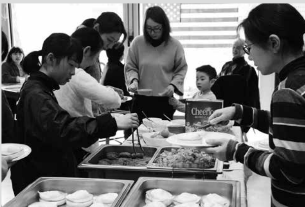
(写真3) おいしそうな料理が並び