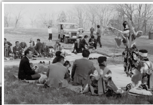
田子神楽の「番楽」を鑑賞中の一枚です。