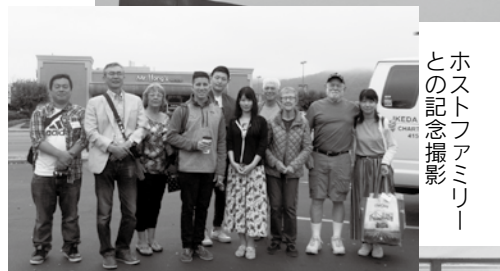
ホストファミリー との記念撮影