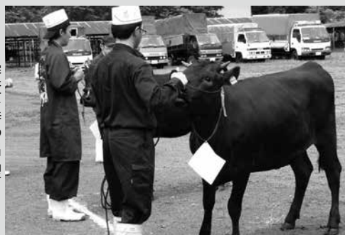
（写真3）審査を待つ出品者