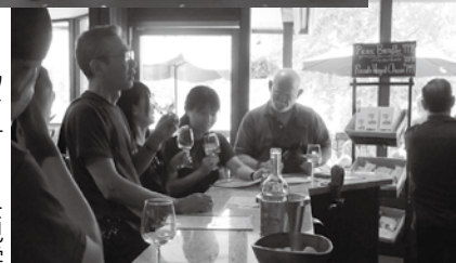
ワイナリーを見学