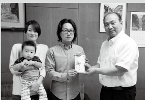
(写真2)対象となったご夫婦