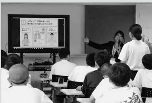
（写真4）スマホ・ケータイと正しくつきあうために