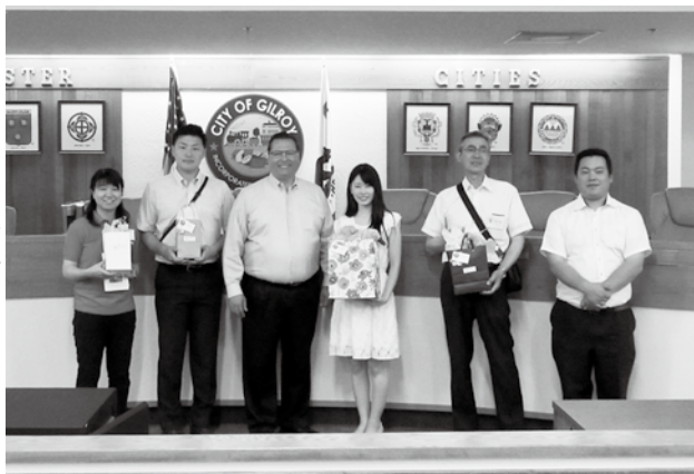
ギルロイ市長表敬訪問