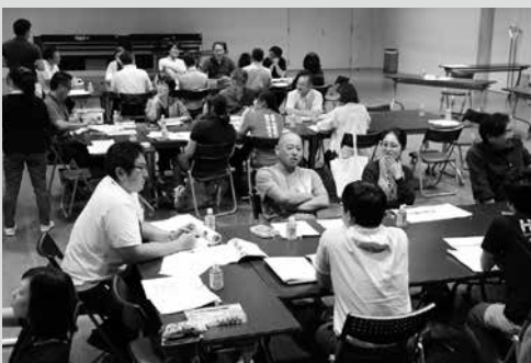
（写真5）グループで意見交換