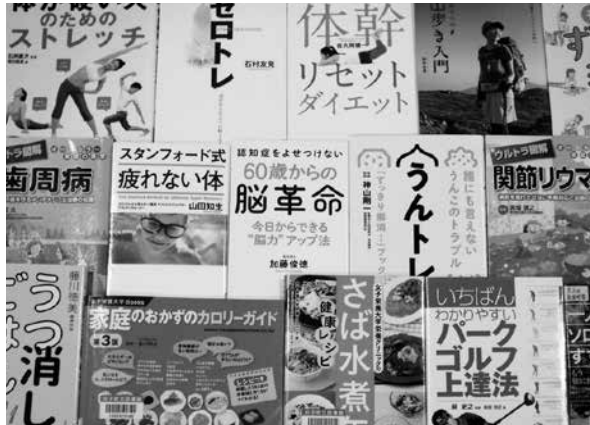
自分に合った健康法を

9月16日は敬老の日です。図書館では「健康」と「運動」に関する本を集めて展示・貸出します。この機会にどうぞご利用ください。