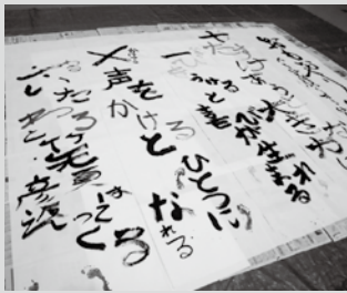
『おもいやり算』 ～人を笑顔にする算数～ 〈5・6年生共同作品〉