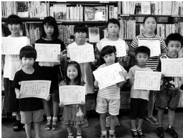
本をたくさん読んだよ!

小学生以下の子どもたちが参加した「読書マラソン」(決められた期間内に何冊の本を借りることができるか自分の記録に挑戦する)が終了しました。今回の参加者は37名、入賞者は22名。1等賞(8日間で40冊読破)から3等賞は次のみなさんです。おめでとうございます。