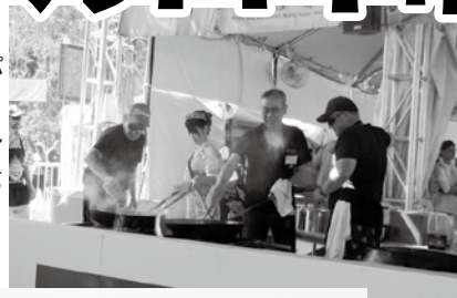
パイロシェフ (炎の料理人) 体験