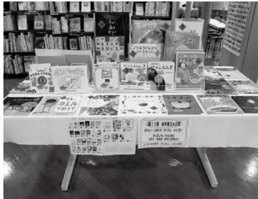
昨年度の展示の様子

絵本を中心に紹介する雑誌「MOE」が全国3000人の絵本専門店・書店児童書担当者にアンケートを実施し、2019年に最も支持された絵本35冊を決定！ 大人も子どもも楽しめる絵本を、図書館で展示・貸出します。