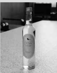
(写真5) アピオス焼酎「きせきれい」