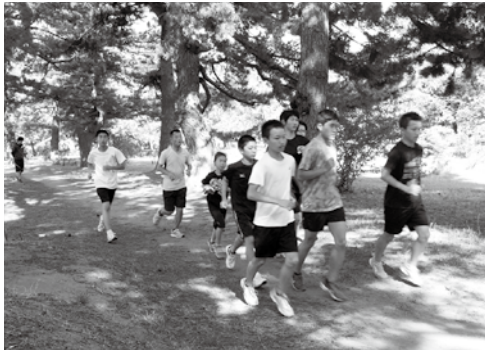
町外での練習風景