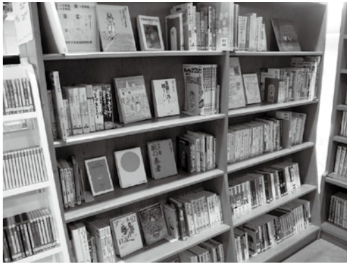
中学校国語教科書で紹介している本など

毎日忙しい中学生・高校生の皆さんにとって、夏休みは読書に親しむチャンスです。図書館に入ってすぐ右側の本棚は、皆さんにおすすめの本を集めた「ティーンズコーナー」です。教科書で紹介している本、心理学、職業、スポーツ、文庫本、コミックなどなど。どうぞこの機会にご利用ください。