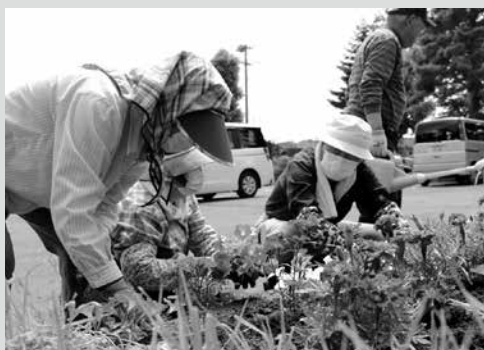
(写真6) 花植えと会話を楽しむ参加者