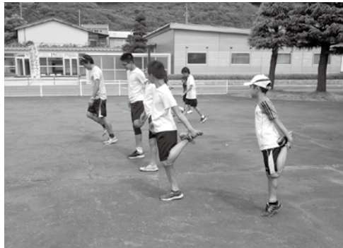
ウォーミングアップの様子