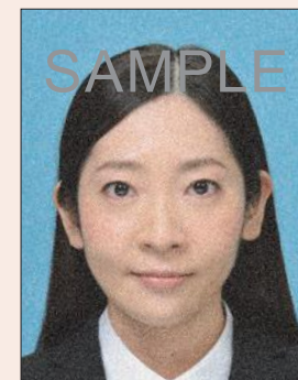
ドットやインクのにじみがあるもの