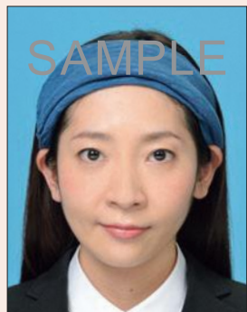
帽子や幅の広いヘアバンドにより頭部が隠れているもの