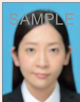
ピンぼけや手ぶれにより不鮮明なもの

撮影時にピントが合っていなかったり、手ぶれしてしまったため画像が不鮮明なもの、顔にてかりやムラがあるものは不適当です。