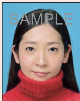
衣服などにより顎などの顔の一部が隠れているもの