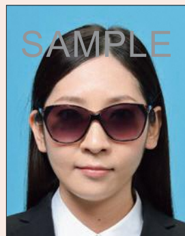
色付きの眼鏡やサングラス

色付きのレンズや反射・影があるものは不適当です。また、目を妨げる縁・フレームがないものに限ります。医療上必要とされない限り、サングラスや処方のない色付きの眼鏡は許可されません。