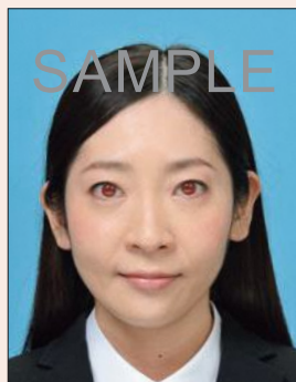
フラッシュなどにより瞳が赤く写ったもの