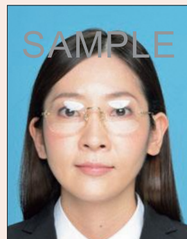
照明が眼鏡に反射したもの