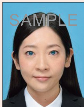
カラーコンタクトを装着したもの

カラーコンタクトを装着したものやフラッシュなどの影響により瞳が赤く写ったものは不適当です。黒目に照明が反射したキャッチライトは問題ありません。