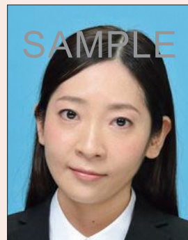
左右に傾いているもの