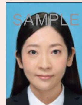
ジャギーがあるもの