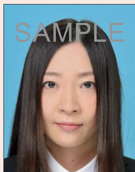
顔の輪郭が隠れるもの