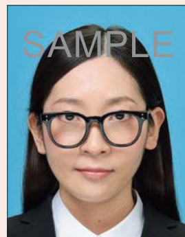
眼鏡のフレームが目にかかっているもの