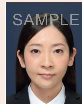
背景の色が濃いもの