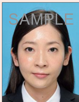
てかりやムラがあるもの