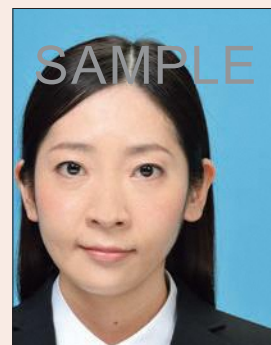
位置が片寄っているもの