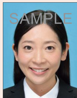
平常の顔貌と著しく異なるもの(口角が上がるなど)