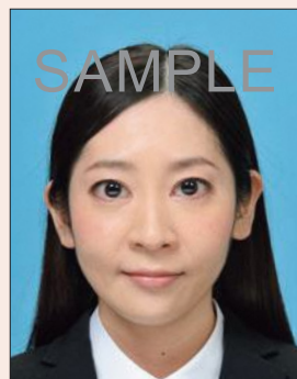
目を大きくしたり、顔のパーツが変形したもの

目を大きく見せたり、美白処理、顔パーツやほころなどを修正するなどして、本人のイメージを変えることは、いかなる場合も不適当です。