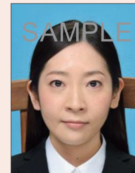
背景以外のものが写り込んでいるもの