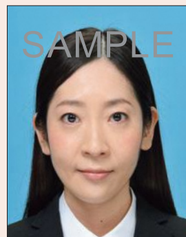
変形やマスクングなどの画像処理をほどこしたもの