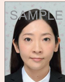
背景に柄があるもの