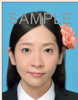
顔や頭の器官が隠れる装飾品などがあるもの