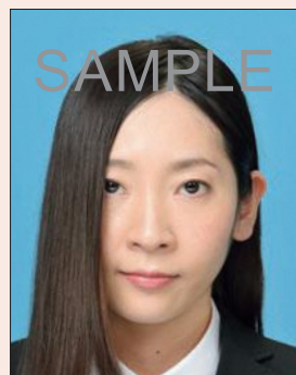
髪が目(黒目)にかかっているもの