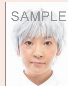
人物と背景の境界が不明瞭なもの