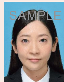
ノイズがあるもの

デジタル画像の過剰な圧縮などが原因となってノイズ(画像の乱れ)が発生しているものや、ジャギー(階段状のギザギザ模様)、印刷時のドット(網状の点)やインクのにじみがあるものは不適当です。写真専用の用紙を使用し、鮮明な画質で印刷してください。