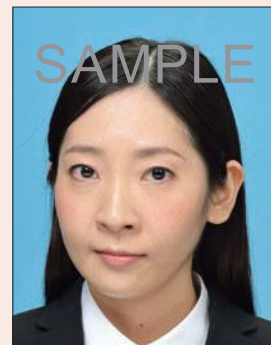
横を向いているもの