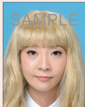
実際の容姿と著しく異なるもの(ウィッグなど)