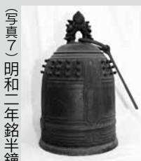
(写真7) 明和二年銘半鐘