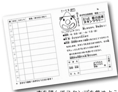
本を読んでスタンプを集めよう！

また、すべての利用者が参加できる「春の読書スタンプラリー」も実施中。ぜひ子どもたちと一緒に、楽しい本の世界をお楽しみください。