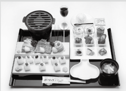
(写真10)ガリステ(略称)2021年度バージョン