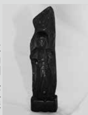
(写真6) 不動明王立像