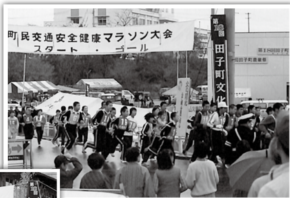
スタート・ゴールは当時の開発センター駐車場(現役場前駐車場)でした。

1983年、町民交通安全健康マラソンの様子です。文化祭・農業祭の開催時期に開催されたようです。