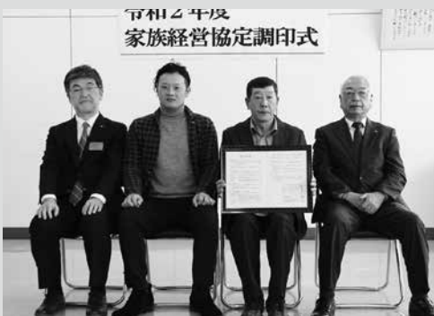
(写真4) 種子さんご家族