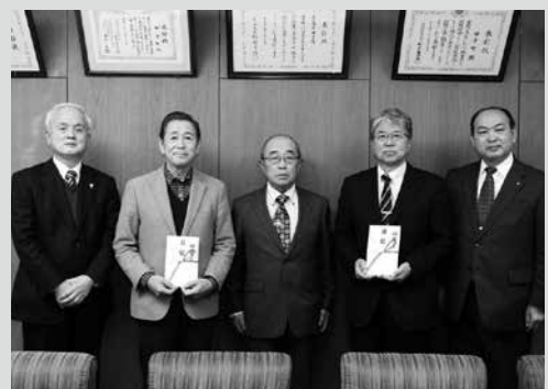
(写真1) (左2人目から) 浪岡理事長、奥家会長、尾形校長