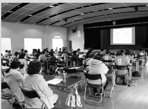
(写真2) 学習会の様子