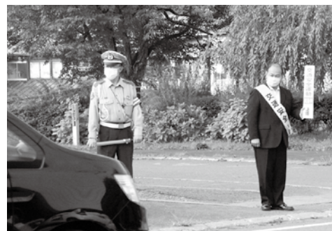
運転者へ「交通安全」を呼びかける様子

子町交通安全母の会連合会の方々が、登校する児童・生徒や行き交う運転者へ、交通安全を呼びかけました。