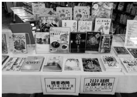
昨年の読書週間本の展示