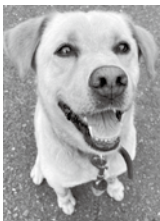
名前は「ほりあい」といいます。