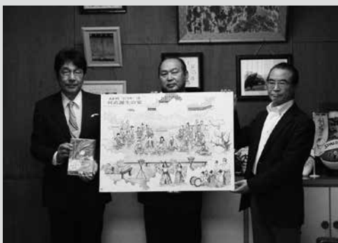
(写真6) 歴史の窓風景画完成報告会の様子