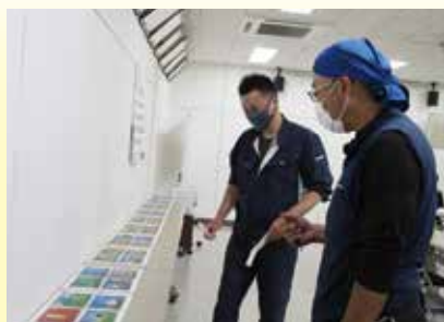
ポスターコンクール審査の様子