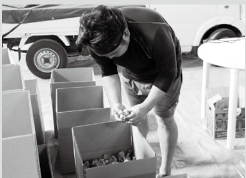
(写真1) 種子のサイズや品質を確認する生産者