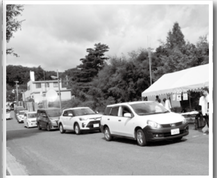
引換場所前の長蛇の列