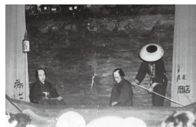
演劇発表会の様子①