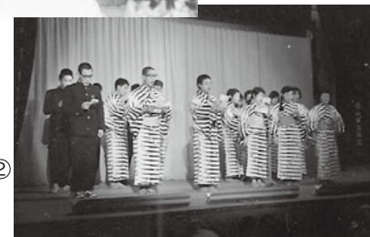
演劇発表会の様子②