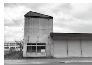
田子公会堂跡地(旧消防署付近)

勉強以外の活動では昭和29年度から毎年「演劇発表会」が行われていました。「田子公会堂」で行い、前売り券を売るなどして、結構観客が入っていたという記録があります。