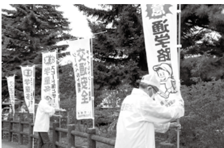
のぼり旗を設置する様子

また、16日には、町内通学路に交通安全を呼びかけるのぼり旗が設置され、30日には、三戸警察署と岩手県三戸警察署及び関係団体が合同で取り組む「A・I（愛）の架け橋セーフティスクールゾーン作戦」が行われ、子どもたちの安全を確保するため、両警察署管内の通学路や学校周辺で、下校時間帯を中心に横断幕やポスターを活用した見守り・警戒活動が実施されました。