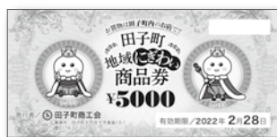
地域活性化商品券カバー