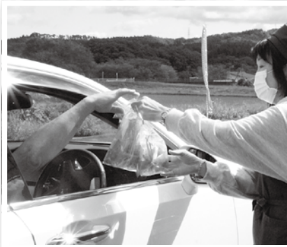
町内出店者によるドライブスルー販売