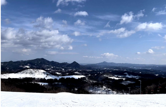
左/ゲレンデ頂上からは遠く名久井岳などの山々が見わたせる