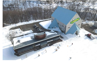
下/スキーセンター(左)と229ドーム(右)