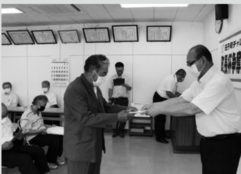
(写真7) チャレンジ大賞の柴倉自治会