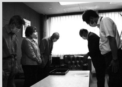
(写真3) 伝達式の様子