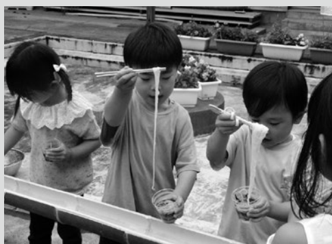
(写真5) 流しそつめんを楽しむ園児たち

7月12日、役場第一会議室で、5月25日に行われたチャレンジデー2022の自治会チャレンジ表彰式が行われました。チャレンジデーは住民の健康づくりと地域の活性化を目的に実施しており、今後さらなる住民参加率の向上を目指しています。結果は次ページのとおりです。