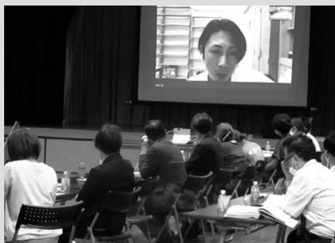
(写真6) オンラインでの講演の様子