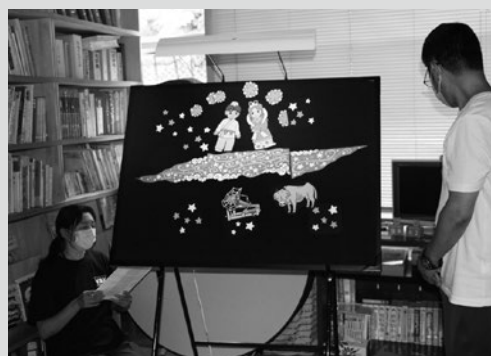
(写真4) 七夕伝説の説明