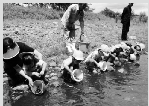
(写真1) 放流体験をする園児たち