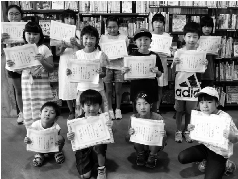
本をたくさん読みました！