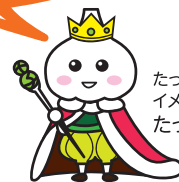
たっこにんにく イメージキャラクター たっこ王子