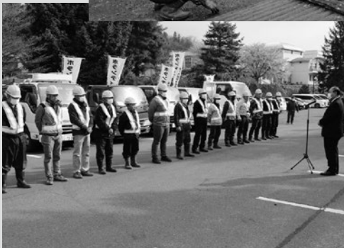
（写真7）ごみ収集出発式