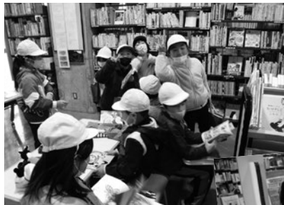
田子小図書館見学