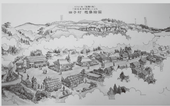
(写真2) 第6弾「田子村 想像絵図」