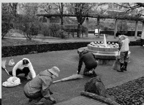
（写真6）清掃活動の様子（七日市）