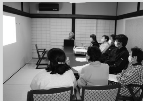
（写真8）お土産作り勉強会