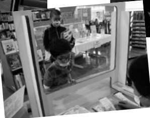
清水頭小図書館見学