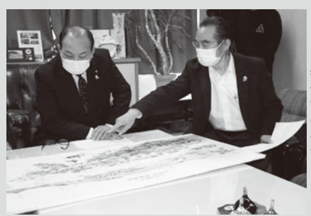
(写真3) 報告会の様子