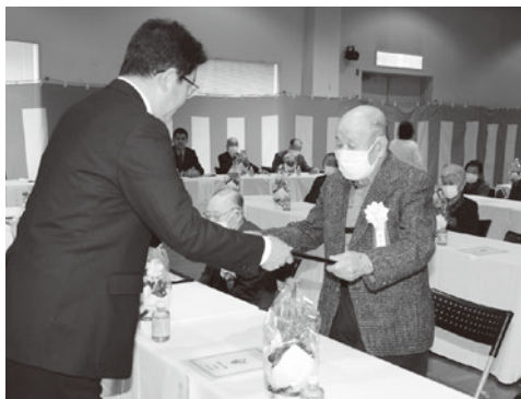
敬老者顕彰状伝達式の様子

11月6日、田子町中央公民館ホールで、令和5年度田子町敬老者顕彰状伝達式が行われました。今年、