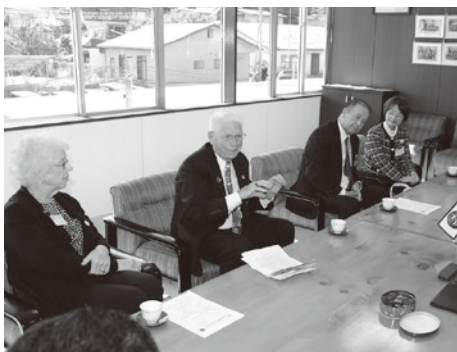
ギルロイ市からの訪問団一行