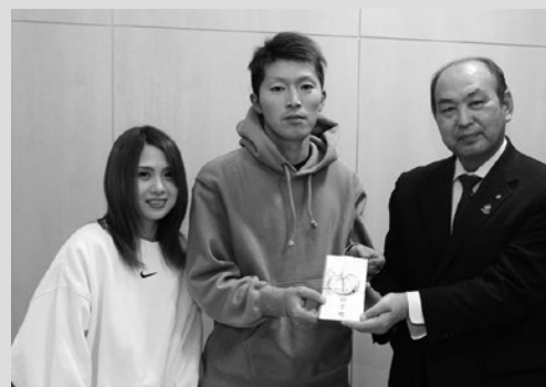
(写真6) 対象となったご夫婦