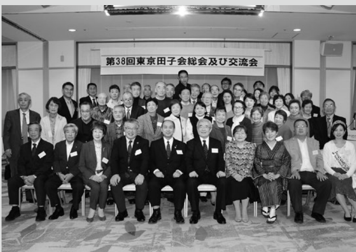
(写真5) 参加者で記念撮影