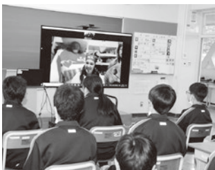
田子中学校での特別授業