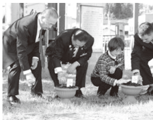
「記念にんにく植え」の様子