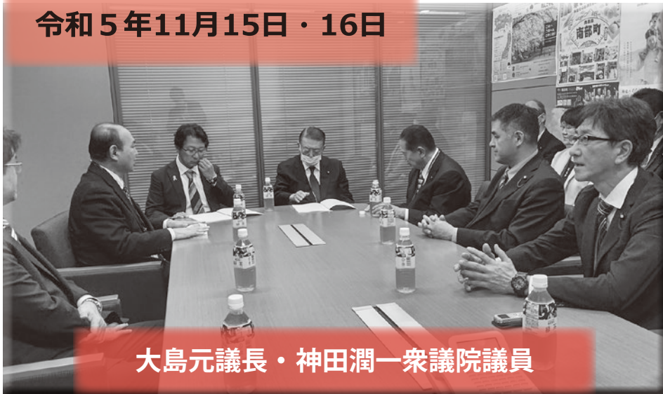
大島元議長・神田潤一衆議院議員