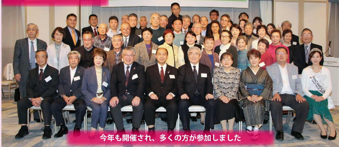
今年も開催され、多くの方が参加しました