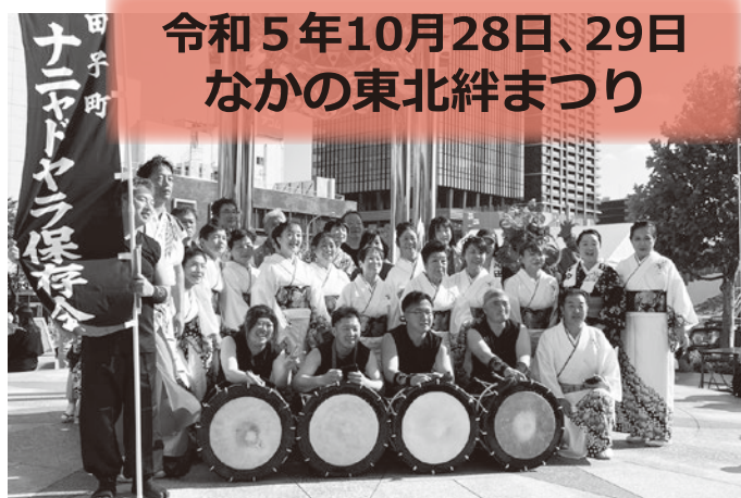
令和5年10月28日、29日 なかの東北絆まつり

今回のイベントへは、田子ファミリーズが出店し、ナニヤドヤラ保存会の皆さんが踊りを披露されました。在京の方も多数参加され2日間にわたり、田子町をPRして頂きました。田子町に興味を持ってもらえるよう、今後とも、工夫をこらす必要があります。