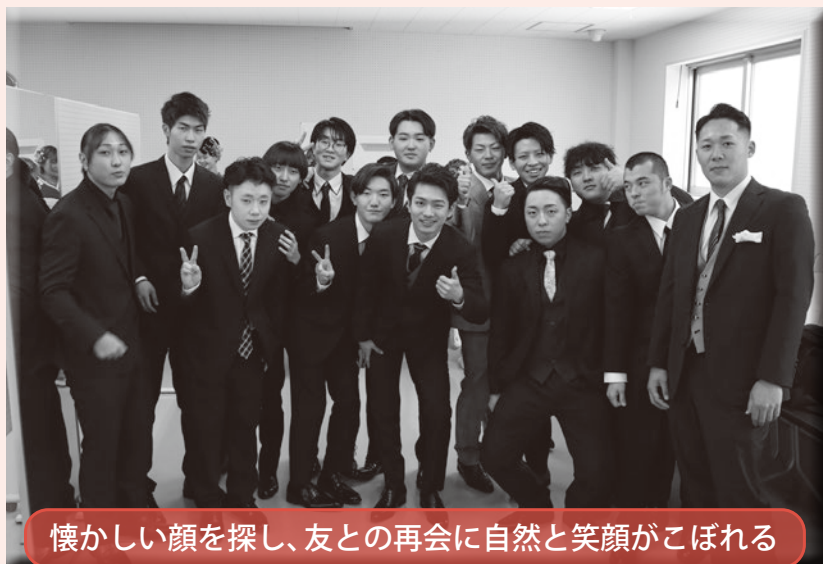
懐かしい顔を探し、友との再会に自然と笑顔がこぼれる