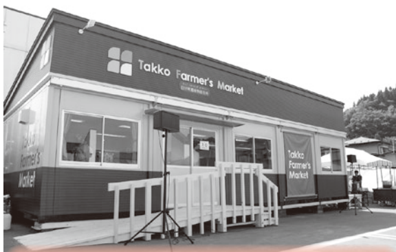
産直は観光面での重要な位置付けにあり、課題も細部にわたる

答 直売所の共通の課題解決に向けて、各団体間の連携・強化は必須であると捉えている。加工施設の整備に向けては、運営方法及び投資的経費にかかる財源等、しっかりとした整備計画をもって進めていく。