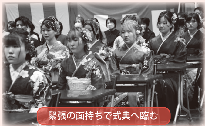
緊張の面持ちで式典へ臨む

令和6年1月7日、中央公民館で二十歳を祝う会が行われました。38人が参加し、共に節目の日を祝った。二十歳となる仲間への祝福と、家族や友人への感謝を胸に未来へ羽ばたく。