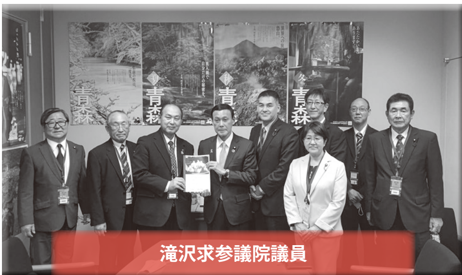
滝沢求参議院議員

青森県、秋田県の両県選出国會議員をはじめ、国土交通省道路局次長へ要望活動を行いました。青森、秋田両県による勉強会の立ち上げなど、着実に前進しています。近隣市町村とも協力を密にし、取り組んで行きたい。