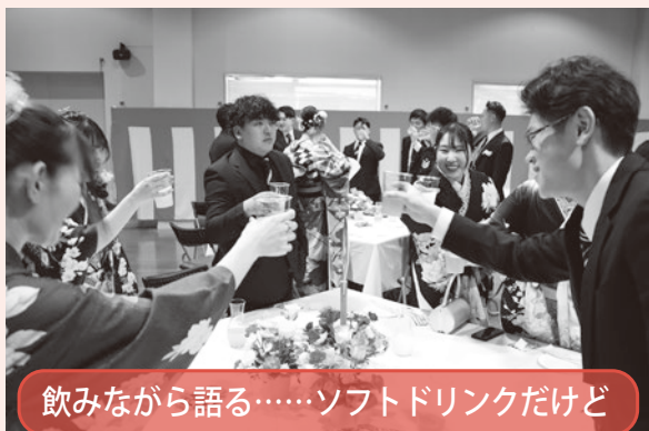
飲みながら語る……ソフトドリンクだけ