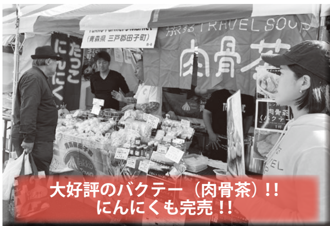
大好評のバクテー（肉骨茶）！！ にんにくも完売！！