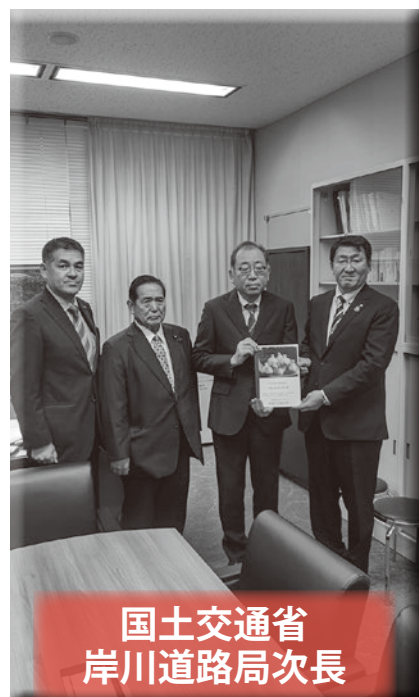
国土交通省 岸川道路局次長

青森県、秋田県の両県選出国會議員をはじめ、国土交通省道路局次長へ要望活動を行いました。青森、秋田両県による勉強会の立ち上げなど、着実に前進しています。近隣市町村とも協力を密にし、取り組んで行きたい。