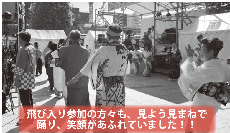
飛び入り参加の方々も、見よう見まねで踊り、笑顔があふれていました！！