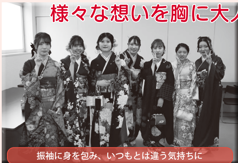
振袖に身を包み、いつもとは違う気持ちに