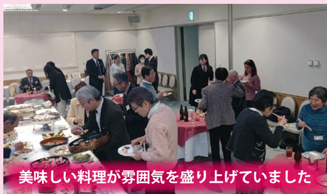
美味しい料理が雰囲気を盛り上げていました

令和5年11月25日、「東京田子会」へ副議長をはじめ議員団として参加してきました。小雨と寒さでありにくの天気でしたが、総会では田子町の近況報告をし、交流会では関東近県に在住する田子町出身者が多数参加され、再会を喜びました。来年も開催し、皆さんと会えることを楽しみにしています。