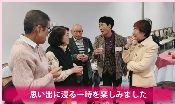
思い出に浸る一時を楽しみました