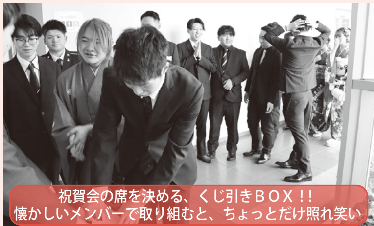
祝賀会の席を決める、くじ引きBOX!! 懐かしいメンバーで取り組むと、ちょっとだけ照れ笑い