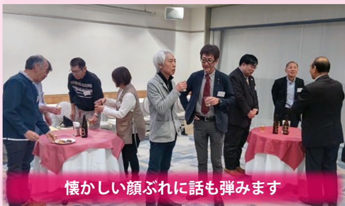
懐かしい顔ぶれに話も弾みます