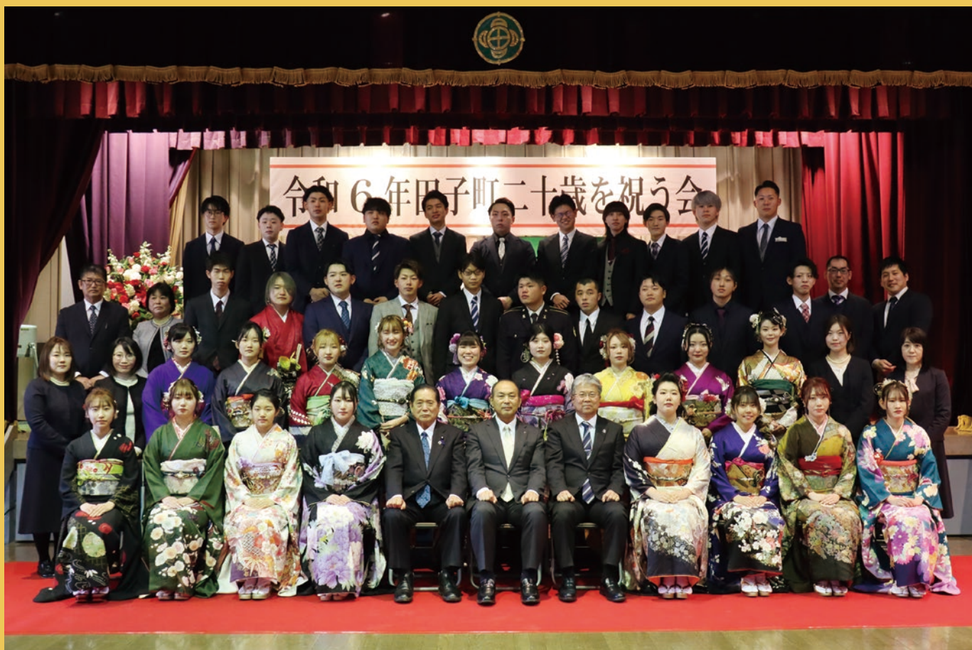
一生に一度の大切な日を迎え、緊張の中にも笑顔が溢れていました