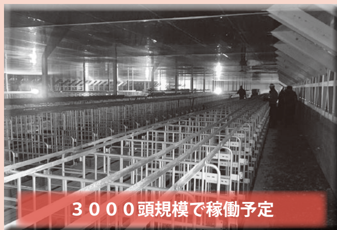
3000頭規模で稼働予定

日本クリーンファーム繁殖農場を視察しました。全体的に建設途中でしたが、担当者からは一部完成次第、稼働していくとの話がありました。