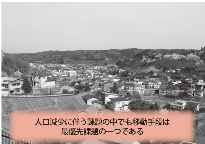
人口減少に伴う課題の中でも移動手段は最優先課題の一つである