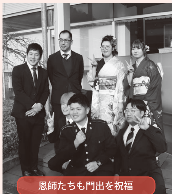
恩師たちも門出を祝福