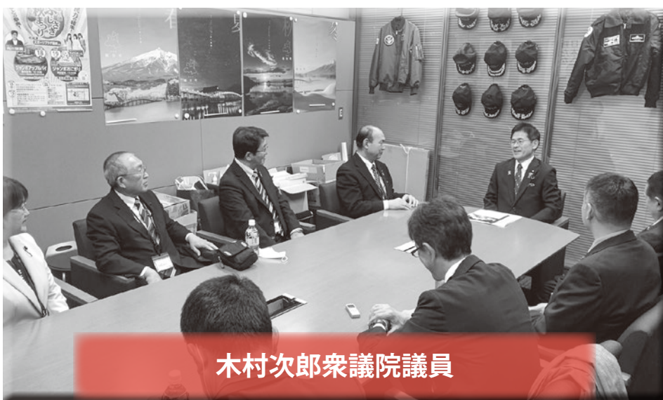
木村次郎衆議院議員